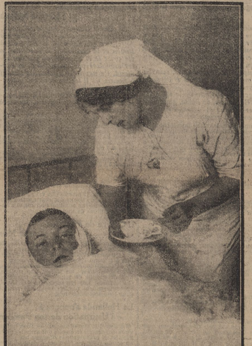
DE BRAVE PETIT ORPHELIN FUT BLESSÉ PAR UN SHRAPNELL EN SUIVANT UN RÉGIMENT D'INF. ERIE