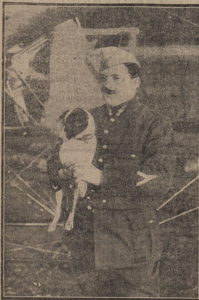
AVIATEUR FRANÇAIS LE PETIT OHIEN QUI L'ACCOMPAGNE DANS TOUS SES RAIDS