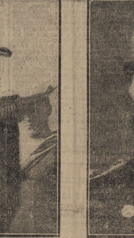
SIR R. PEIRCE Commandant de l'Escadre des Indes Orientales.