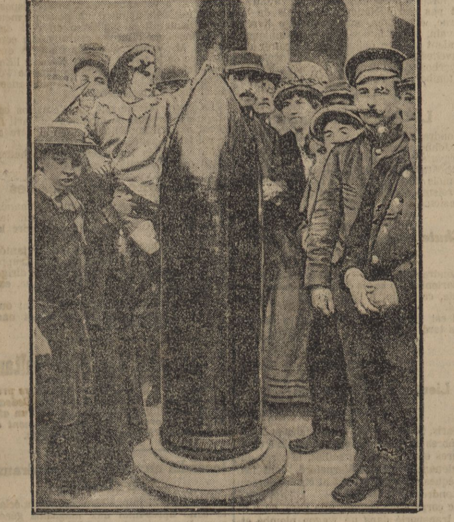
Obus de 420 exposé aux Invalides. Cet obus mesure 1 m. 54 de haut et pèse 558 kilos