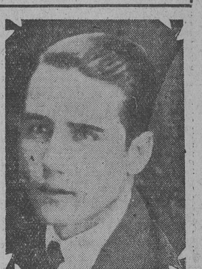
Secretario de la municipalidad

mente a las autoridades municipales. Como se ha dicho al principio, inconvenientes que escapan a la órbita de acción de la comuna, han trabado en toda forma la realización de proyectos que habrían significado un visible progreso edilicio.