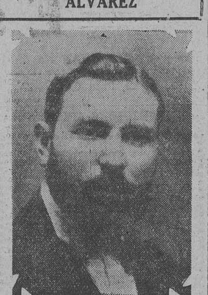
Juez de paz suplente