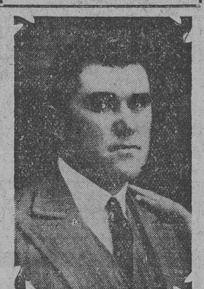
Integrante del Concejo Municipal

a la comuna los problemas vinculados con la asistencia social.