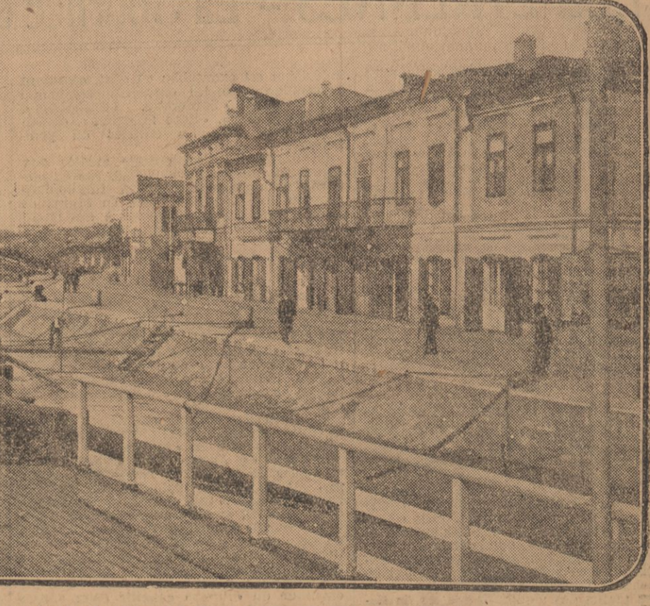
Vue de la ville de Braïla, devant laquelle les Russo-Roumains résistent héroïquement aux troupes de Mackensen.