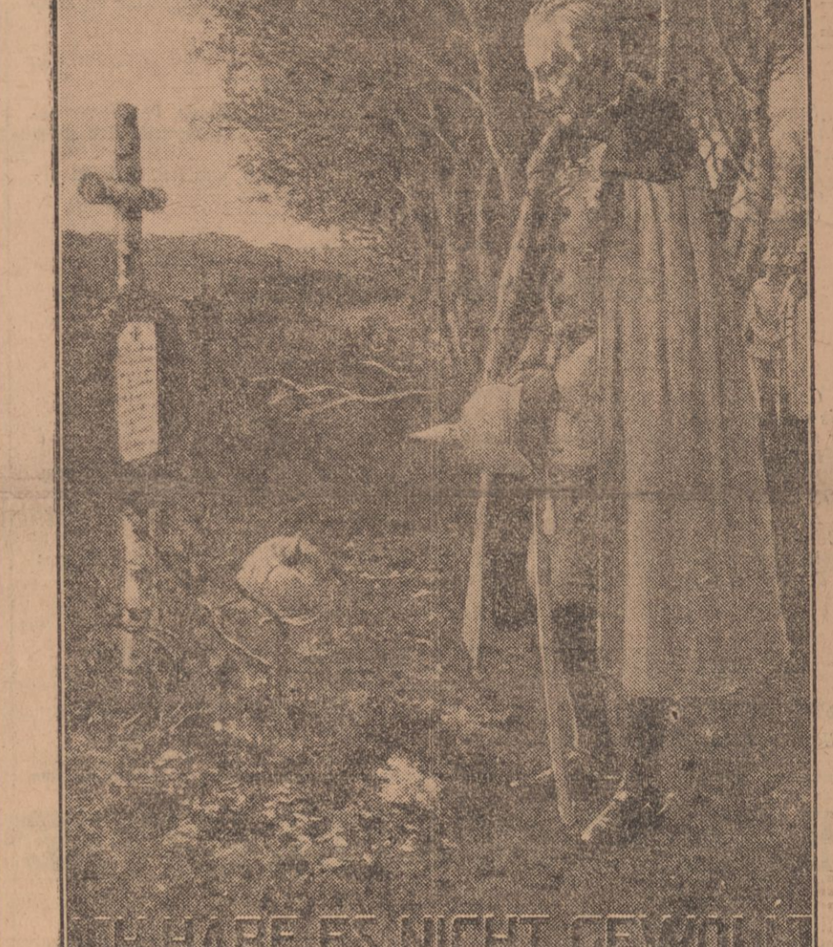
Cette carte postale est répandue à profusion en Allemagne par les soins du kaiser lui-même. Elle représente le ministre allemand prônant la venue d'un soldat, et prônant la fameuse phrase : de moi pas vous cela.