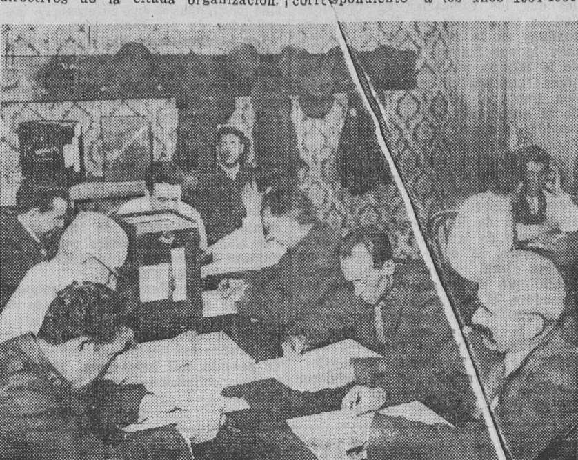
PRACTICANDO EL ESCRUTINIO DEL VOTO GENERAL, celebrado por los tranviarios, en una de las urnas seccionales

De acuerdo a lo que adelantáramos en nuestra anterior edición, durante el día de ayer escrutáronse en la secretaría de la Unión Tranviarios los sufragios emitidos en el reciente voto general hecho para elegir los cuerpos directivos de la citada organización.