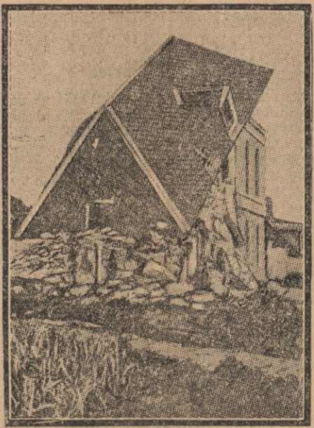
Curieux effet d'un projectile ayant frappé une maison sur une façade taratara.