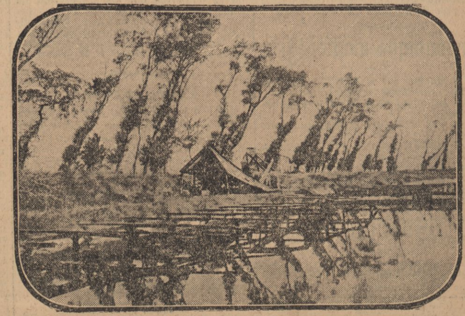
LES BORDS DE L'YSER