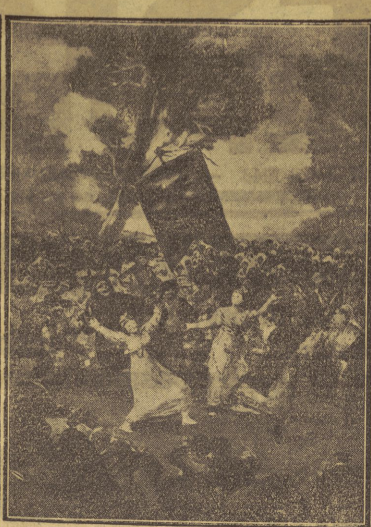
libre cours à ses inquiétudes spirituelles, et pour exprimer sa pensée critique.