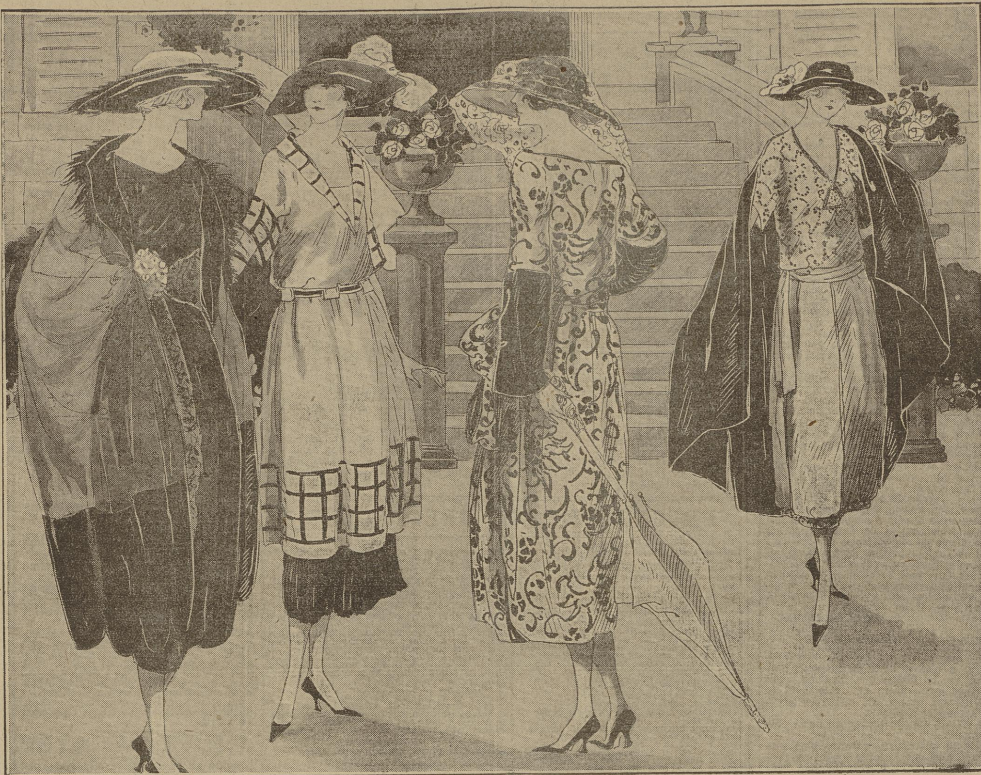
Robe de satin et mousseline de soie; cape assortie, garnie de singe. — PREMIET.