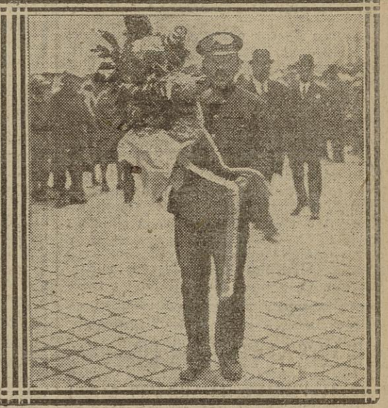
1. M. SARRAUT; 2. M. STEEG. — ARRIVÉE DE M. MÉLINE. — M lle MILLERAND (X) VIENT AUX RENSEIGNEMENTS. — LE DÉPART DE M. COMBES. — FLEURS JETÉES D'UN AVION