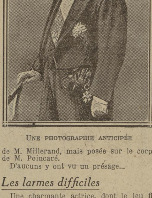
UNE PHOTOGRAPHIE ANTICIPÉE de M. Millerand, mais posée sur le corps de M. Poincaré.

Les plus opulentes, celles qui arrivent dans les automobiles les plus récentes, ne s'auraient-elles témoigner un peu de discrétion ?