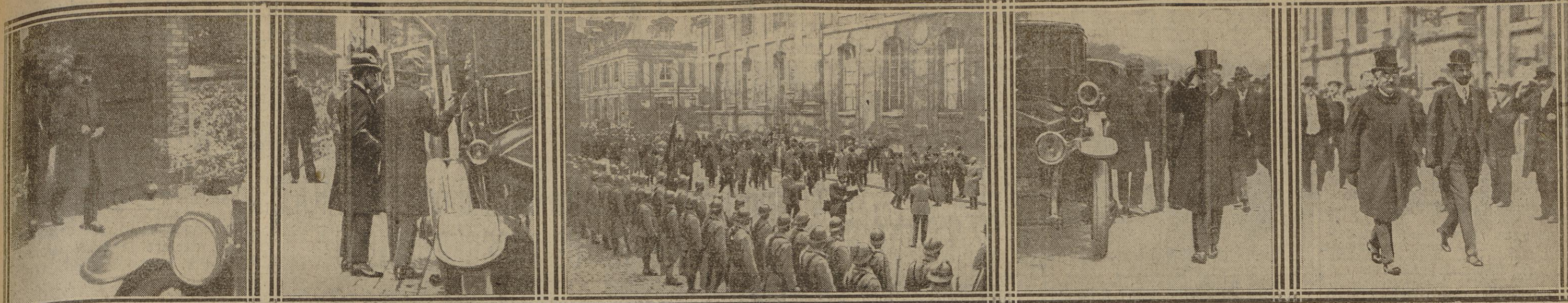
M. MILLERAND PART DE CHEZ LUI. — SES FILS LUI DISENT AU REVOIR. — L'ARRIVÉE AU PALAIS DE VERSAILLES. — M. MILLERAND QUITTE SON AUTO. — A L'ENTRÉE DU PALAIS.