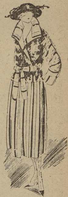
MODELE FRANCIS Manteau de duvetine et taupe.

J'ai fait croquer pour vous, chez Francis, cette semaine, un manteau de duvetine combinée avec de la taupe. La fourrure constitue tout le corps du vêtement; elle est découpée en festons assez larges au-dessous de la taille, et incrustée dans le tissu rayé violet, vert, blanc et jaune.