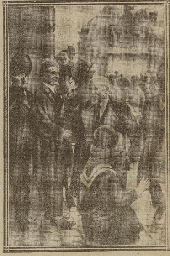
L'ARRIVÉE DE M. POINCARÉ