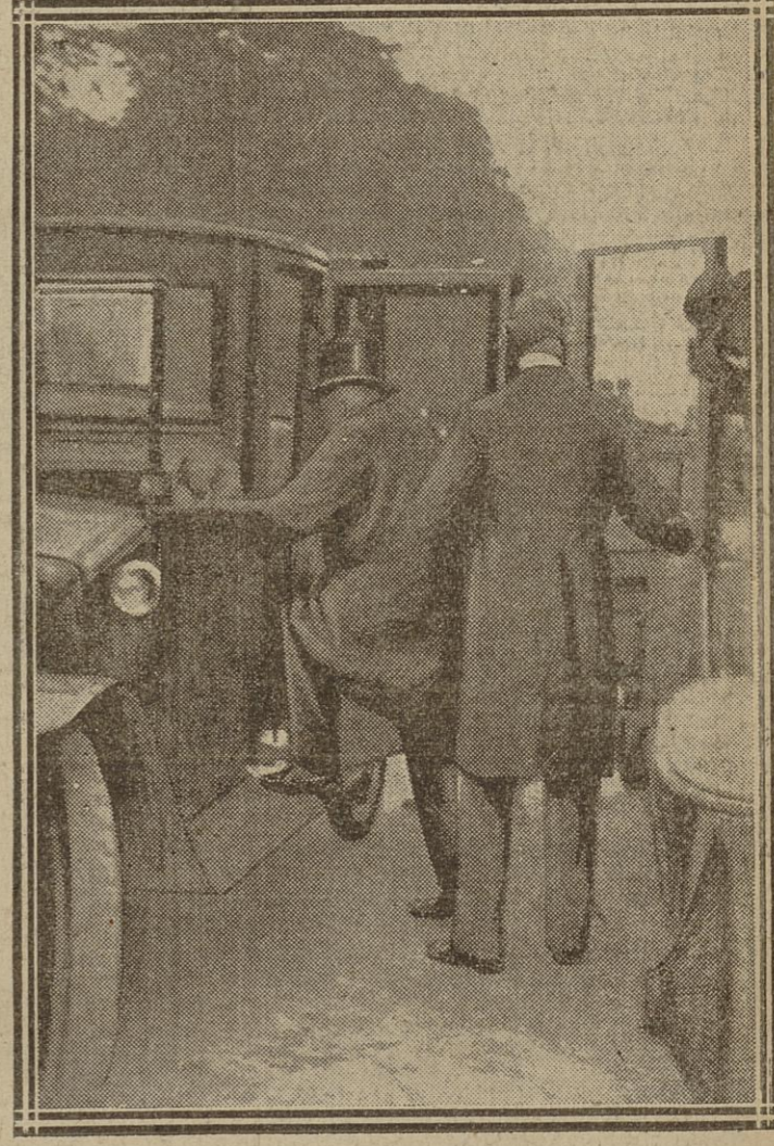
M. MILLERAND, ÉLU, SORT DU CONGRÈS. — A L'ÉLYSÉE : M. MILLERAND ET LE MINISTÈRE DÉMISSIONNAIRE. — LE PRÉSIDENT CHANGE DE VOITURE A LA PORTE DAUPHINE

de l'Étoile, des deux côtés des Champs-Élysées jusqu'à l'avenue Marigny, c'est un océan humain des grandes journées historiques à Paris.