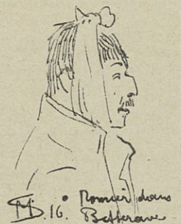
M. 16. Betterave

c is nog al onverschrokken voor een nuichtere buitenjongen niet heel gevestigd zelf voor een vertrouwenwenschtigmoed, maar 't schijnt een parijzenaar zoo natuurlijk voor te komen, dat het daar heart een alledaagsche toestand blijkt. — Misschien is het dit wel, en hebben de schrijvers in dit stuk gelegenheid gevonden om dat alles eens ferm over den hekel te halen. —