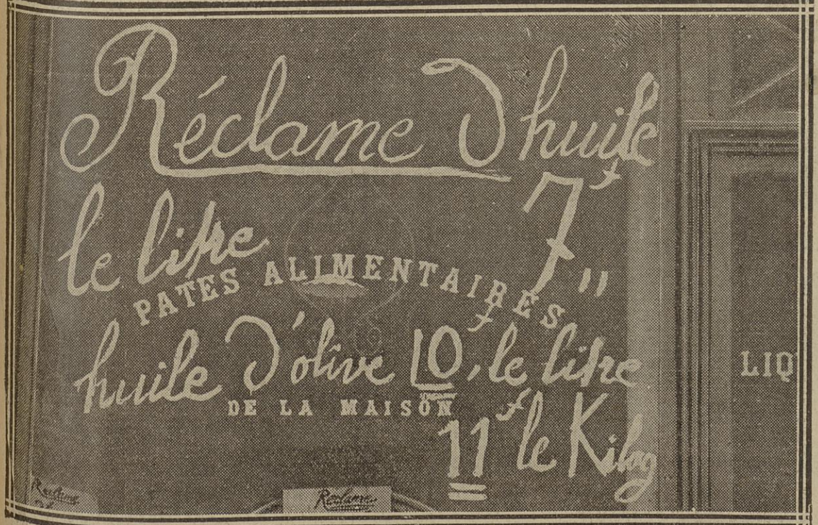
BAISSE SUR L'HUILE (DE 14 A 11 FRANCS) : RUE GAY-LUSSAC (V e )