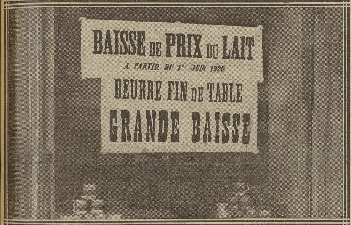
BAISSE SUR LE LAIT ET LE BEURRE : FAUBOURG-POISSONNIERE (IX e )