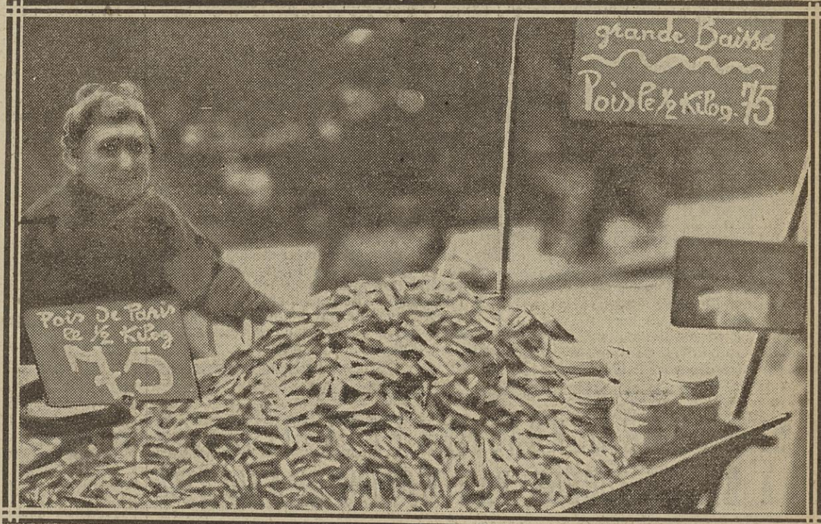
BAISSE SUR LES PETITS POIS : AVENUE DE CLICHY (XVII e )