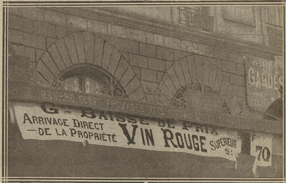
BAISSE SUR LE VIN : RUE LAFAYETTE (X e )