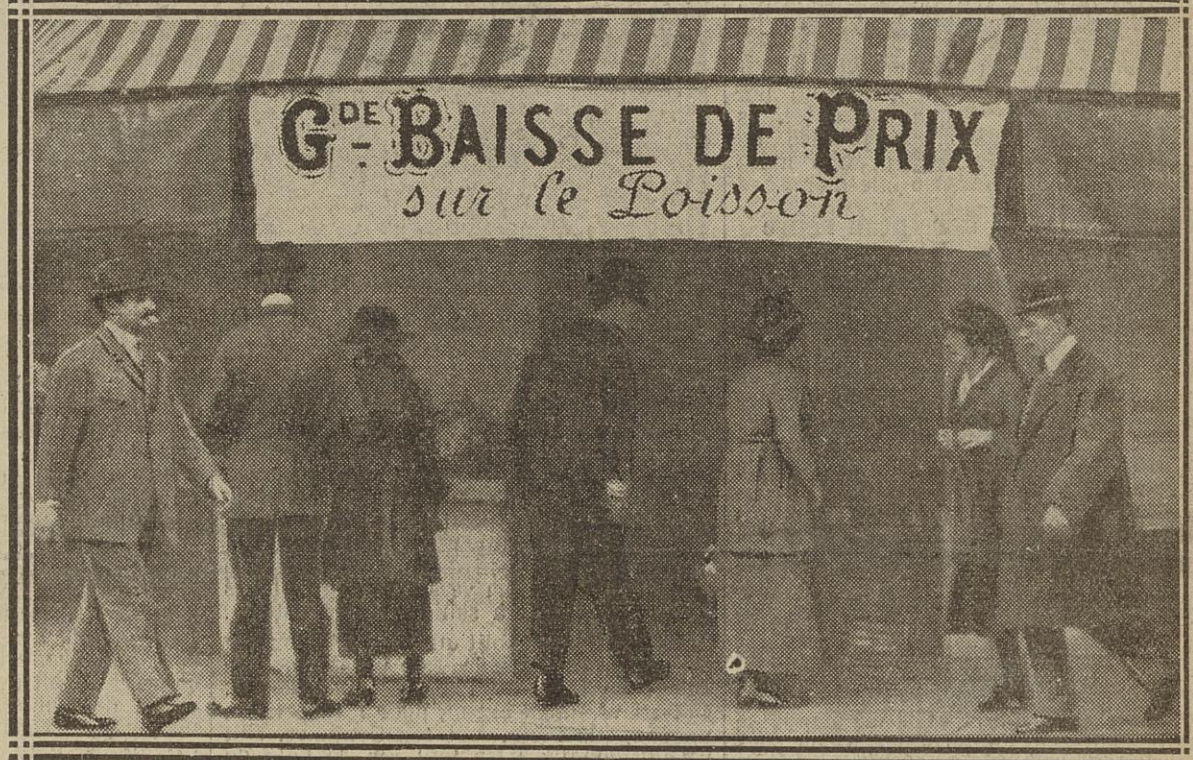
BAISSE SUR LES POISSONS : FAUBOURG-MONTMARTRE (IX e )