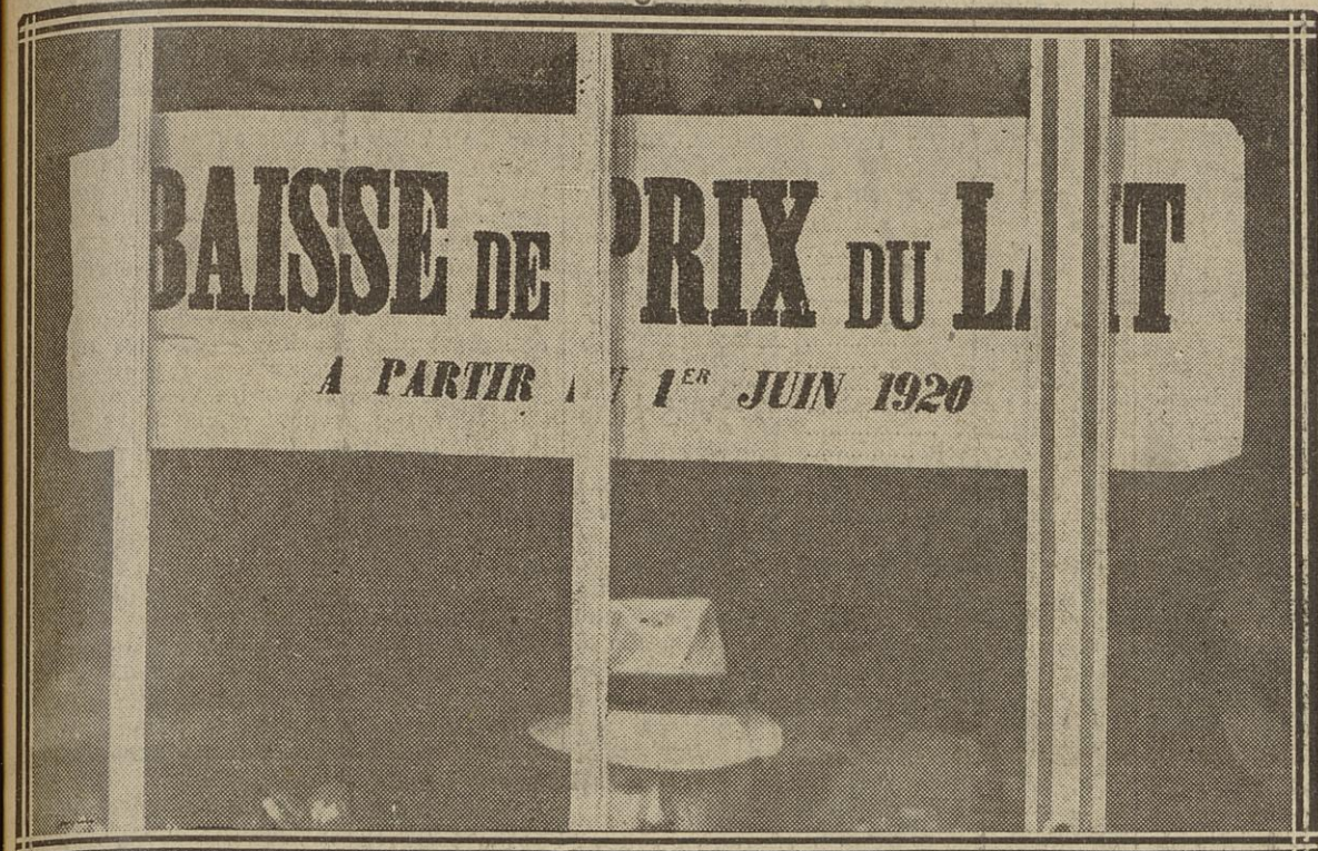
BAISSE SUR LE LAIT : RUE BEAUBOURG (III e )

CE QUE VALAIT ET CE QUE VAUT NOTRE FRANC EN ANGLETERRE