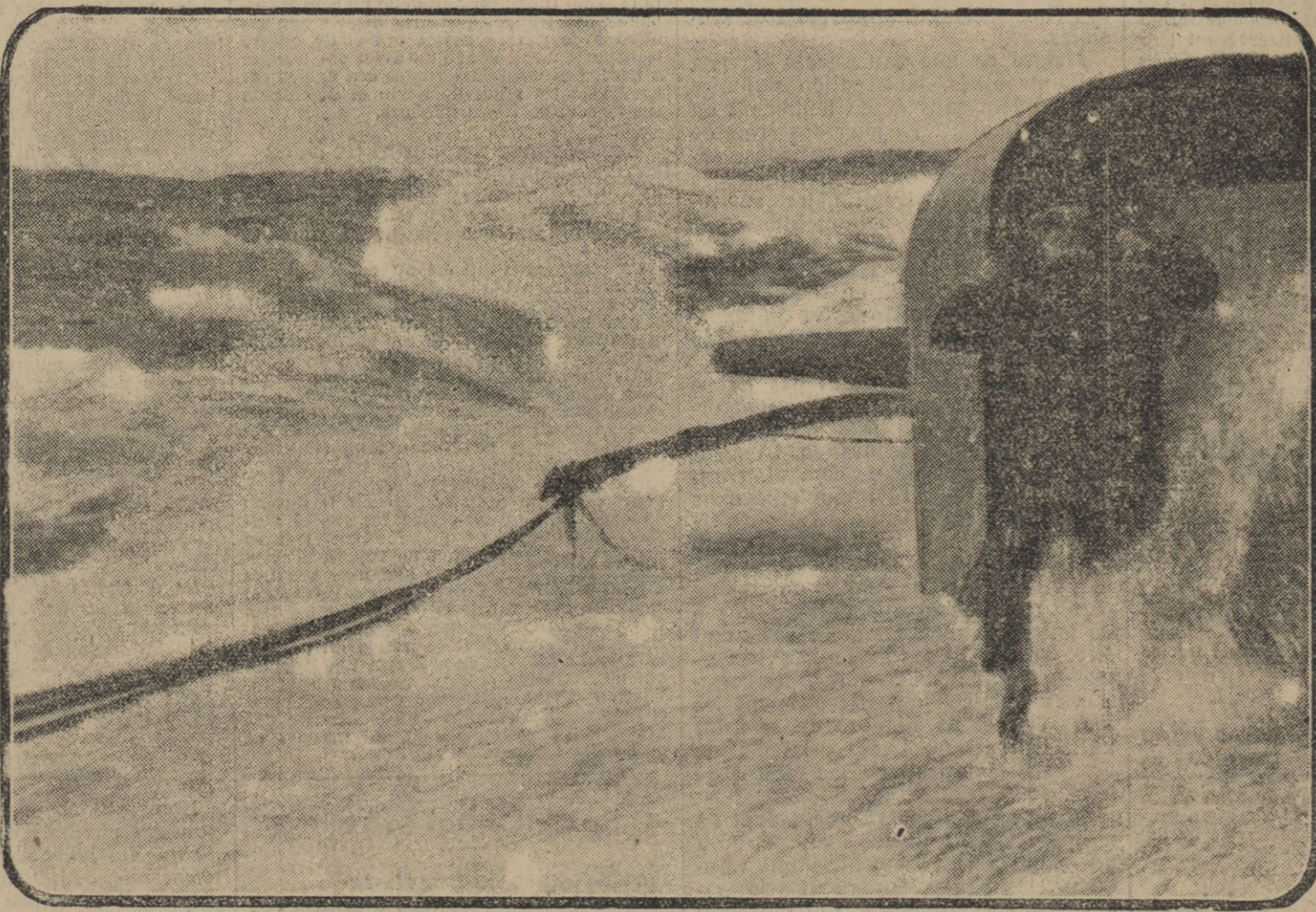
LE PONT D'UN CROISEUR ANGLAIS BALAYÉ PAR LES LAMES