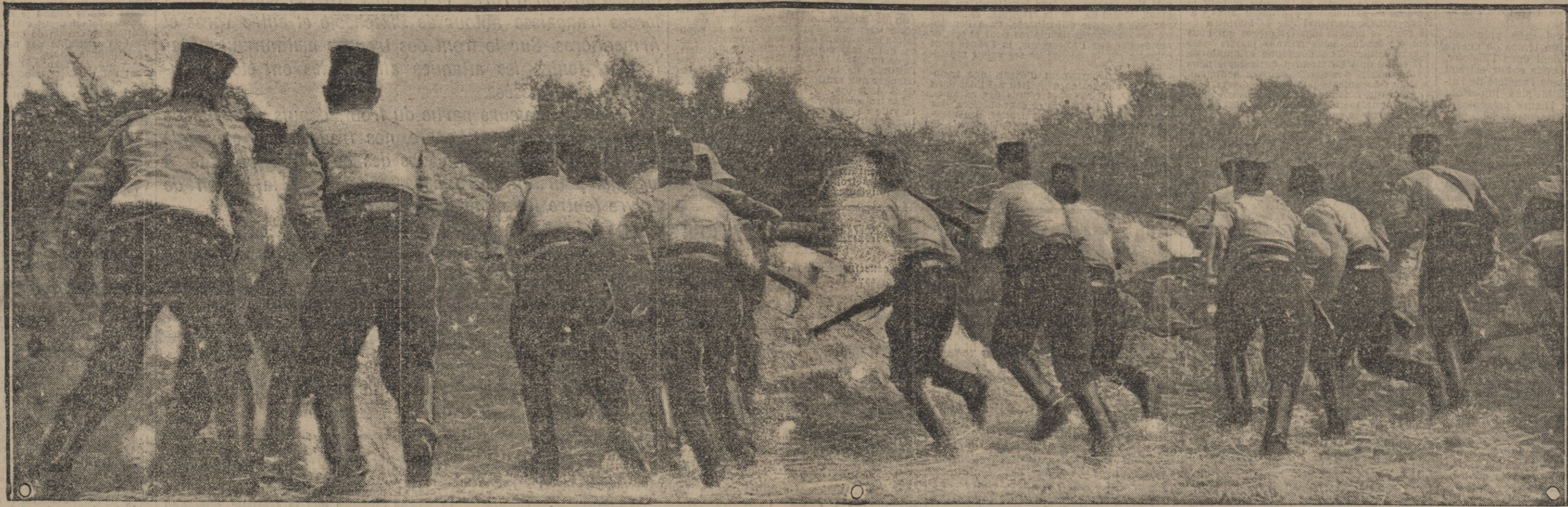
Chasseurs d'Afrique combattant à pied et prenant leurs positions pour repousser une attaque ennemie