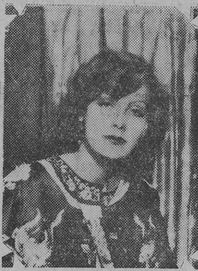
GRETA GARBO, LA PROTAGONISTA DEL FILM "INSPIRACION", A ESTRENARSE HOY.

Si usted puede, no deje de enviarnos algún obsequio para rematar a beneficio de la deuda: Casa del Pueblo.