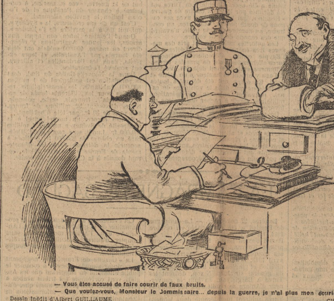
Vous êtes accusé de faire courir de faux bruits. Que voulez-vous, Monsieur le Journaliste... depuis la guerre, je n'ai plus mon droit de courir...