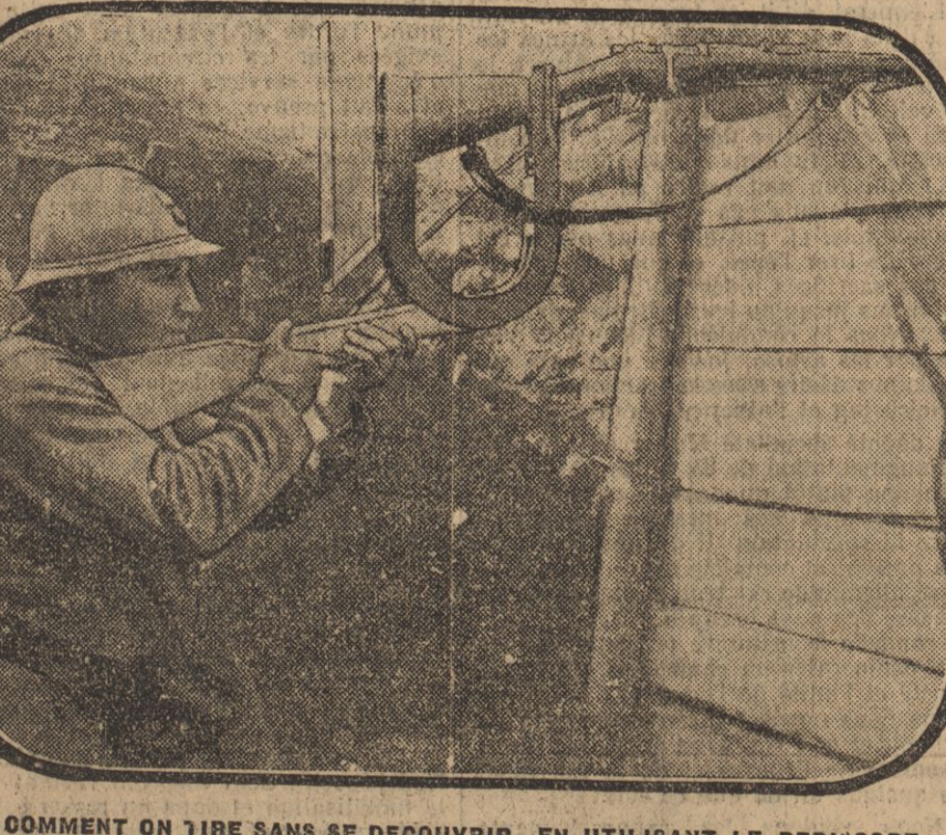
COMMENT ON TIRE SANS SE DECOUVRIR EN UTILISANT LE PERISCOPE

Sois tranquille! Je découvrirai un cadavre suffisamment calme et grandiose pour que le descendant de tes ateux n'y soit point déçagé!