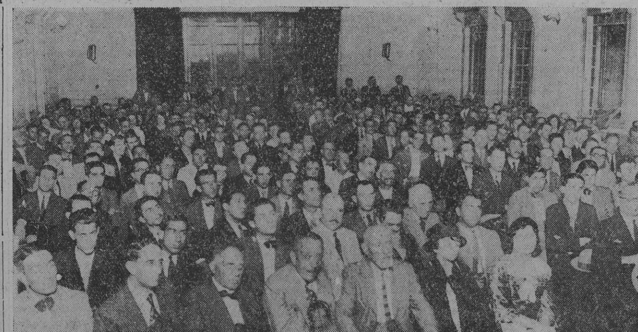
Parte del público que asistió anoche al acto de homenaje a la memoria de Turati

Por último y a pedido de los asistentes hizo uso de la palabra el camarada Frugoni, que fué objeto de una ovación clamorosa. Frugoni, en una brillante improvisación se refirió a ciertos aspectos íntimos de la vida de Turati que demostraban la gran inquietud espiritual de su carácter y que completan el cuadro de la recia y compleja personalidad del gran luchador. Tuvo luego palabras de censura para los gobiernos de fuerza que obligan a los hombres que no comulgan con sus ideas bárbaras a abandonar su país, sus hogares, su puesto de la cha y refugiarse en los países vecinos desde donde se contempla impotente el desborde de las más bajas pasiones. Es necesario evitar esta situación y para ello todos los trabajadores cobijados bajo la bandera de lucha del Partido Socialista deben tratar de obtener cada vez mayores conquistas, conquistas materiales, pero que estas conquistas materiales no sean un peso muerto sobre sus espaldas, sino que tengan la fuerza del motor que mueve las alas y ayudan a volar. Terminó su discurso dando un viva a la democracia y a la libertad que el público rubricó con grandes aplausos, vivando a la democracia y expresando su repudio por las dictaduras.