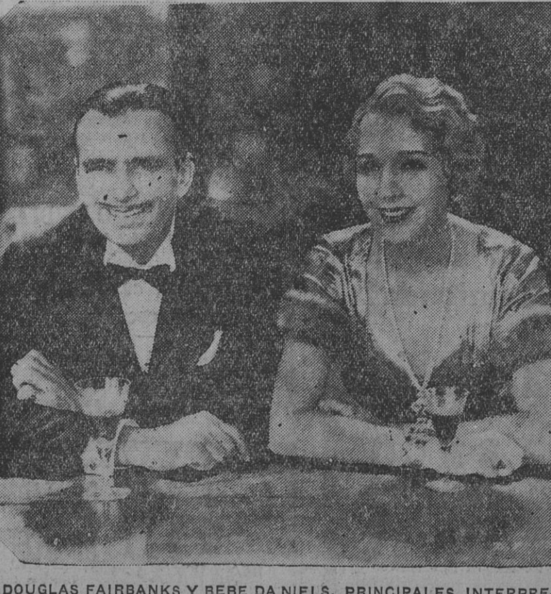
DOUGLAS FAIRBANKS Y BEBE DANIELS, PRINCIPALES INTERPRETES de la película "Alcanzando la luna", que se estrenará hoy.

En Caja de Ahorros después de 60 días . . . . . el 4 %