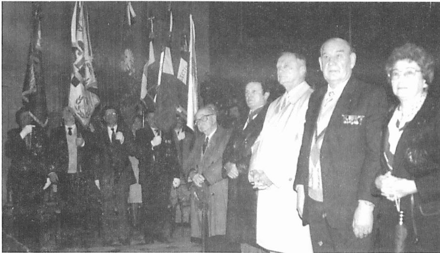
Une cérémonie a réuni tous les nombreux amis du Maréchal ZDROJEWSKI en l'église polonaise pour le deuxième anniversaire de sa mort.