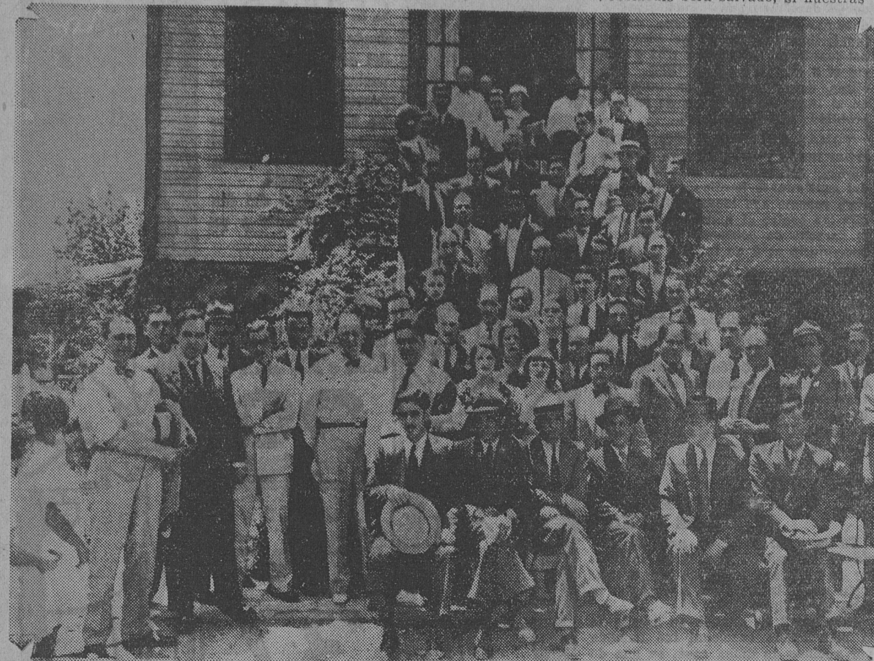
PARTE DE LA CONCURRENCIA QUE ASISTIO AL ALMUERZO OFRECIDO POR LA UNION OBREROS MUNICIPALES a los delegados de la Confederación Nacional de Empleados de Comercio.