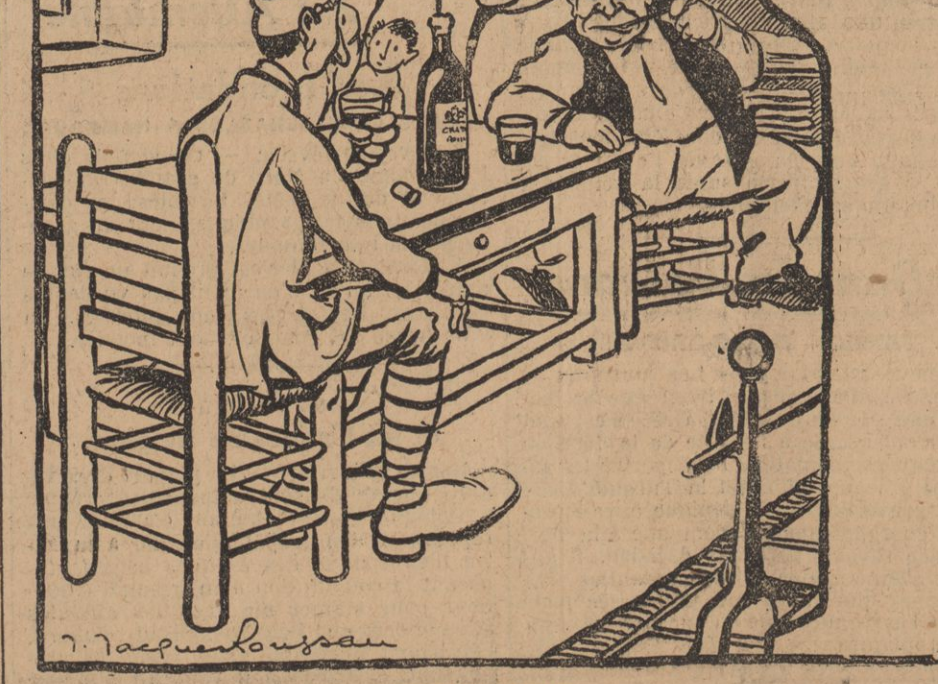
JUSQU'AU BOUT — Parfaitement ! mon p'tit gars, il faut rester vingt ans dans la tranchée, nous y resterons ; nous nous priverons tant qu'il le faudra, et nous tindrions jusqu'au bout !

Reproduction d'une page en couleurs de LA BAIGNETTE.