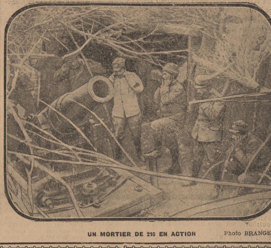
UN MORTIER DE 210 EN ACTION