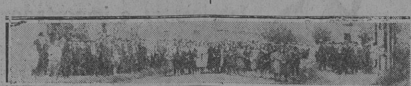
PARTE DE LA CONCURRENCIA A LA ASAMBLEA AL FINALIZAR el acto.

En el local de la Confraternidad Ferroviaria, sección Zárate, realizaron una imponente asamblea los obreros de la fábrica de papel de la Compañía Papelera Argentina, quedando definitivamente constituido el sindicato.