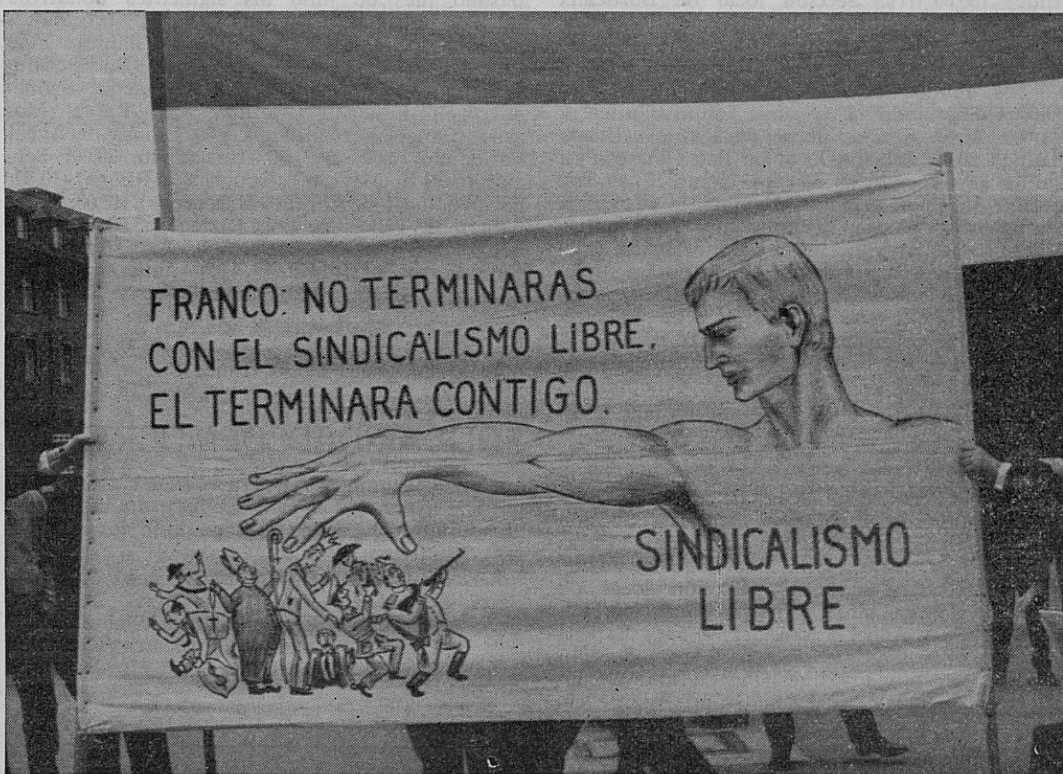
Uno de los carteles, que los compañeros de la Sección de la U.G.T. llevaban en la manifestación del 1º de Mayo celebrada en Zurich. Detrás se ve la bandera republicana.

Para coordinar un apoyo intensivo por parte de los Sindicatos a los trabajadores extranjeros se encargará a la D.G.B. la publicación de Boletines de información en los diversos idiomas extranjeros.