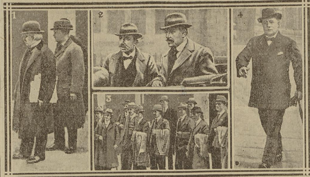
INSTANTANES PRIS, AVANT-HIER, AU MOMENT OU LA GREVE A ÉCLATÉ. Voici : 1. M. Lloyd George quittant le n° 10 de Downing street, où a eu lieu la dernière conférence avec les représentants des cheminots; 2. M. C. F. Cramp et J. H. Thomas, secrétaires du comité des cheminots, arrivant au meeting; 3. Les cheminots délégués; 4. Sir Eric Geddes arrivant à la conférence qui devait échouer.

Camions automobiles et chauffeurs sont réquisitionnés de manière à assurer la distribution du pain et du lait à Londres et dans tous les grands centres de l'Angleterre.