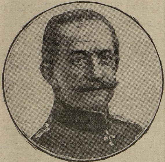
GÉNÉRAL VON BISSING

LONDRES, 7 janvier. — Suivant un télégramme de Bruxelles, le général von Bissing, en raison de son état de santé, n'est pas à même de retourner en Belgique : il doit continuer sa cure à Wiesba-