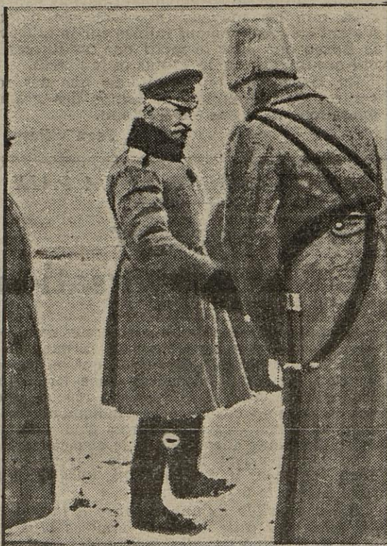
LE GÉNÉRAL BROUSSILOFF salué par un de ses officiers.

LAUSANNE, 8 janvier. — La Strasburger Post écrit qu'une grande nervosité règne sur tout le front allemand occidental. Cette nervosité, qui s'est étendue aussi à toute l'Allemagne, est due en grande partie aux mouvements de troupes qui ont lieu constamment.