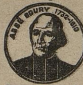
Exiger ce portrait.

est composée de plantes inoffensives sans aucun poison, et toute femme soucieuse de sa santé doit, au moindre malaise, en faire usage.