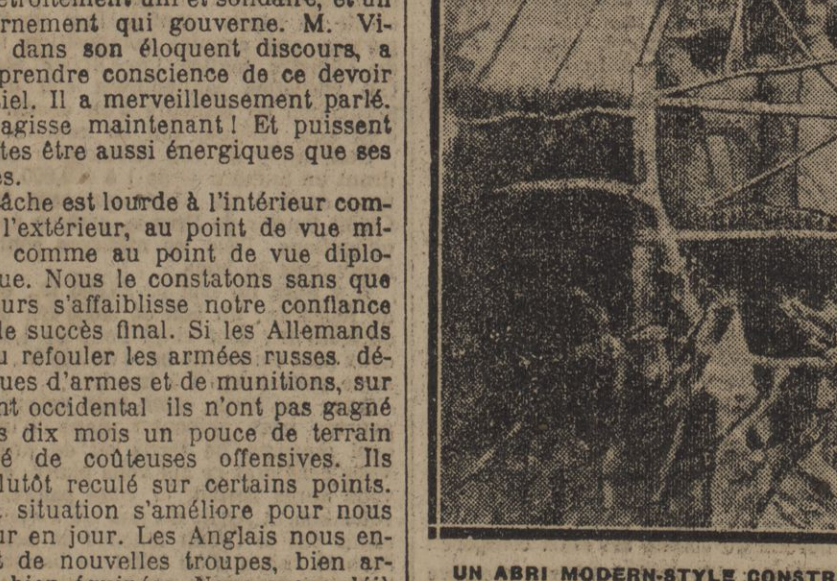
UN ABRI MODERNE-STYLE CONSTRUIT PAR DES POILUS DU SUD-OUEST