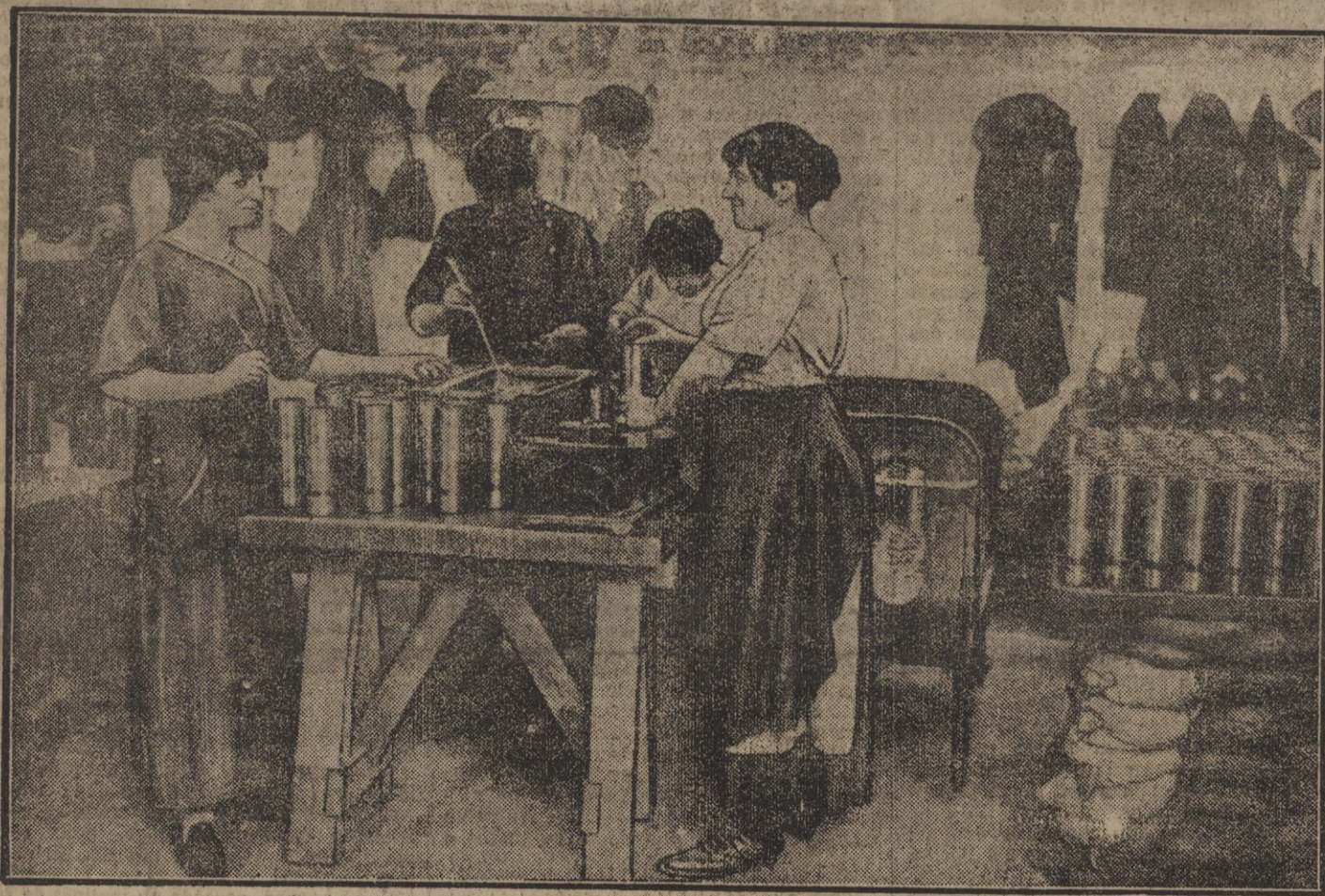
FABRIQUATION DES SHRAPNELS