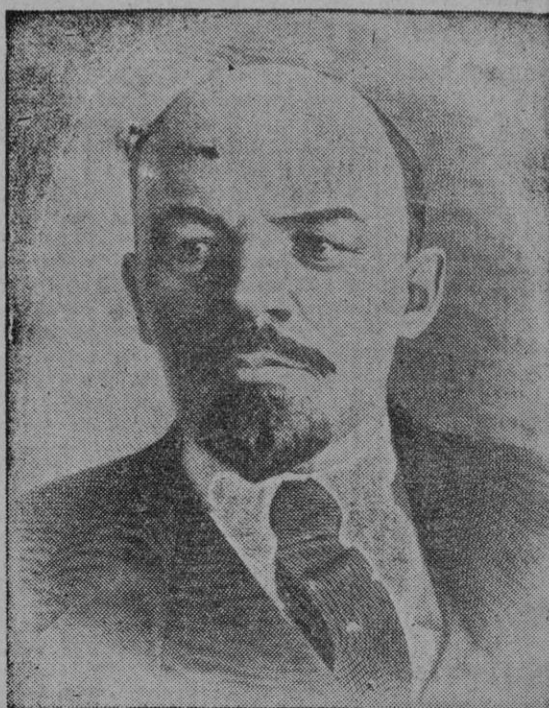
Recordad, amad, estudiad a Ilich, a nuestro maestro, a nuestro jefe.

Luchad y venced a los enemigos interiores y exteriores como lo hacía Ilich.