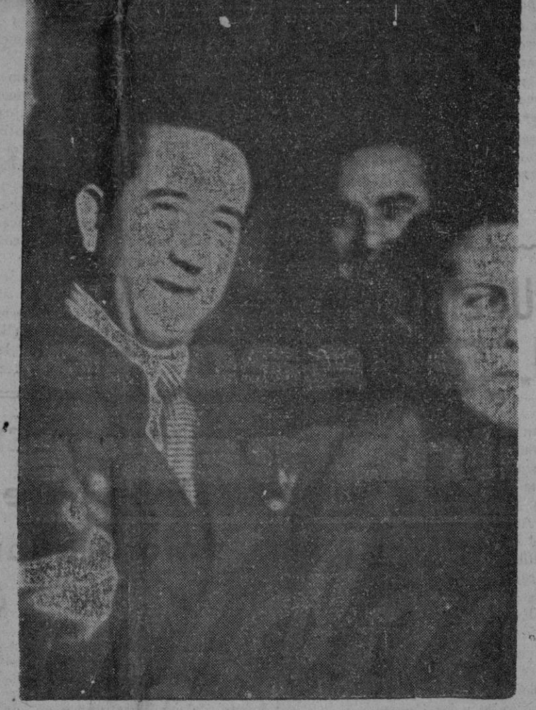
El camarada Mije a su llegada a la estación de Toulouse. El lunes día 3 de diciembre, en el tren de París, llegó a Toulouse el camarada Antonio Mije, miembro del Buró Político del Partido Comunista de España, diputado a Cortes de la República.

Muchas voces en el campo democrático y antifranquista coinciden en proclamar la objetividad y el realismo de la solución preconizada por el Partido Comunista de España en el Pleno de Toulouse.