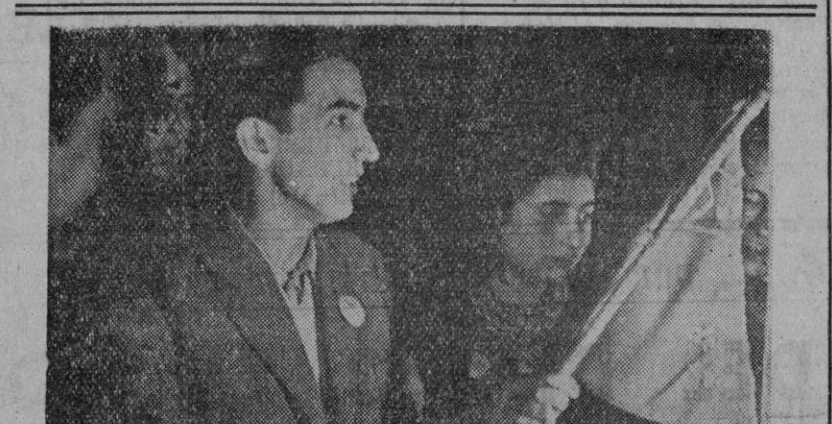
Entrega del bonerín en la Conferencia de la J. S. U.

Estos hechos de lucha tan significativos y otros de índole semejante últimamente producidos serán comentados por «Unidad y Lucha» en su próximo número.