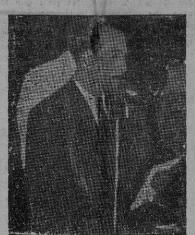
PRESTES, pronunciando su discurso en el homenaje a «Pasiónaria»

Empezó diciendo que el homenaje dedicado a «Pasiónaria» es un motivo de orgullo y de alegría para los comunistas brasileños. Pero que también le trae más vivo el recuerdo de otras dos mujeres que fueron amigas de Dolores y abnegadas luchadoras del Brasil: la madre y la hermana de Prestes, caídas en la lucha.