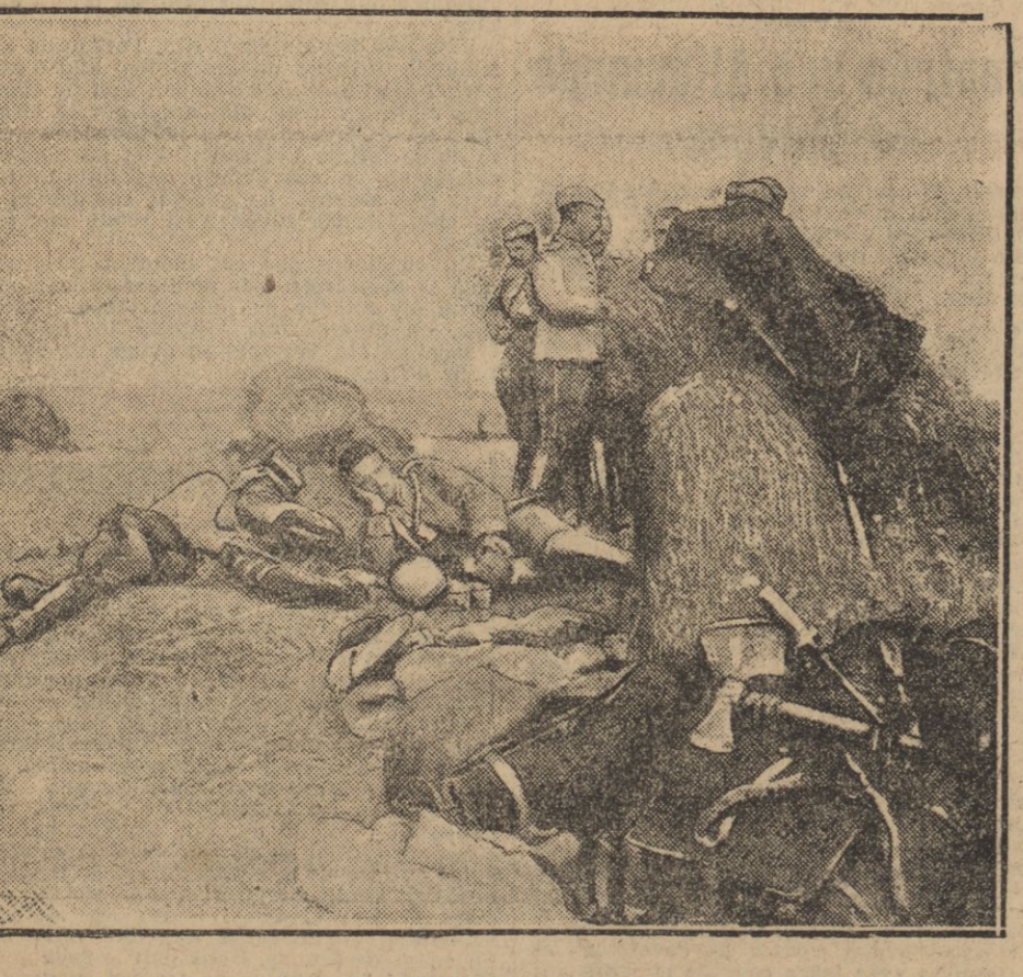
Un soldat allemand capturé par des soldats français se repose en attendant de rejoindre les autres prisonniers.