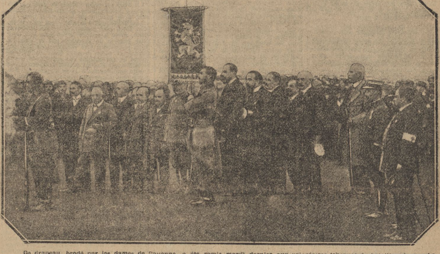
Le drapeau, brodé par les dames de Guyonne, a été remis mardi dernier aux volontaires tchèques du bataillon de marche...