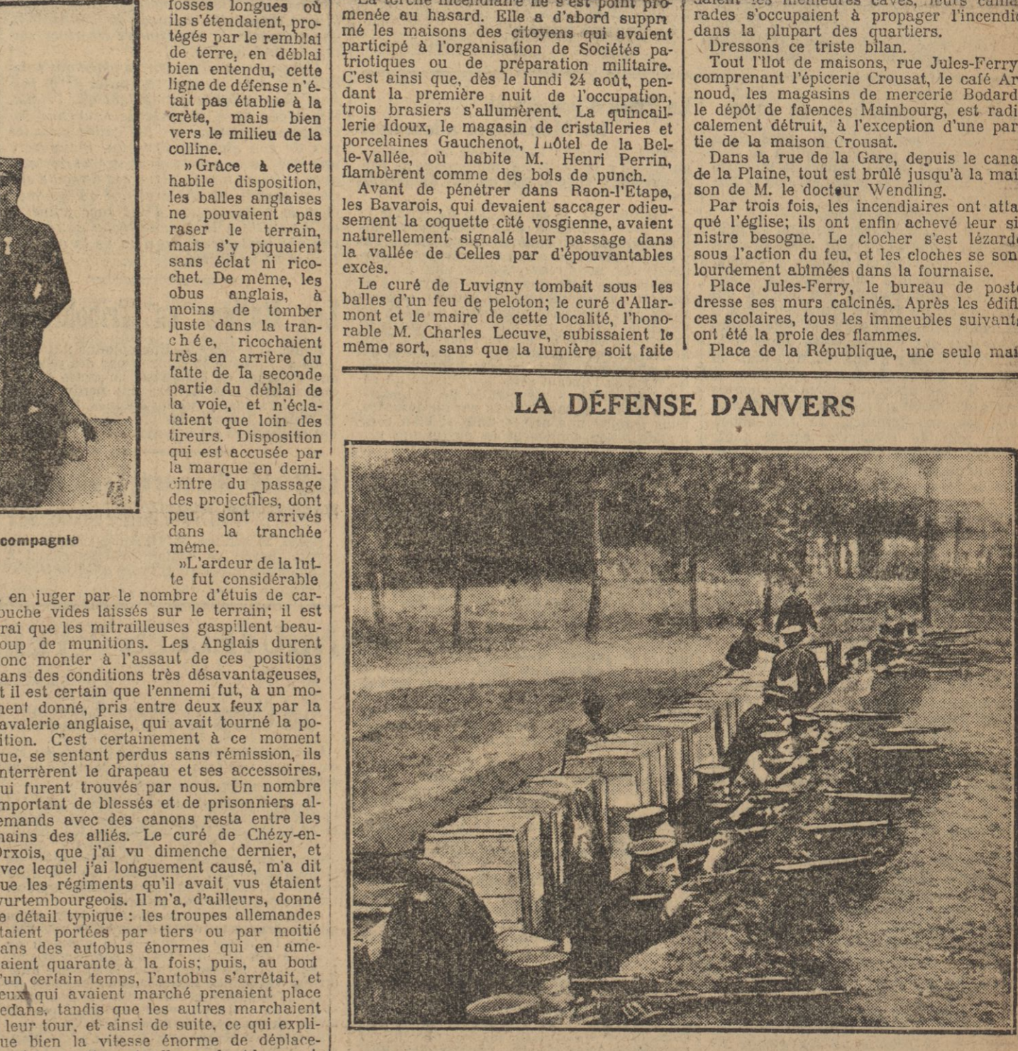
MARINS ANGLAIS DANS LEURS TRANCHÉES

Et du reste, l'affaire est-elle si grave? peu à peu, tout en l'observant, il amena l'entretien sur les Jorancés. — Suzanne est venue ce matin? — Marie se sent étonnée.