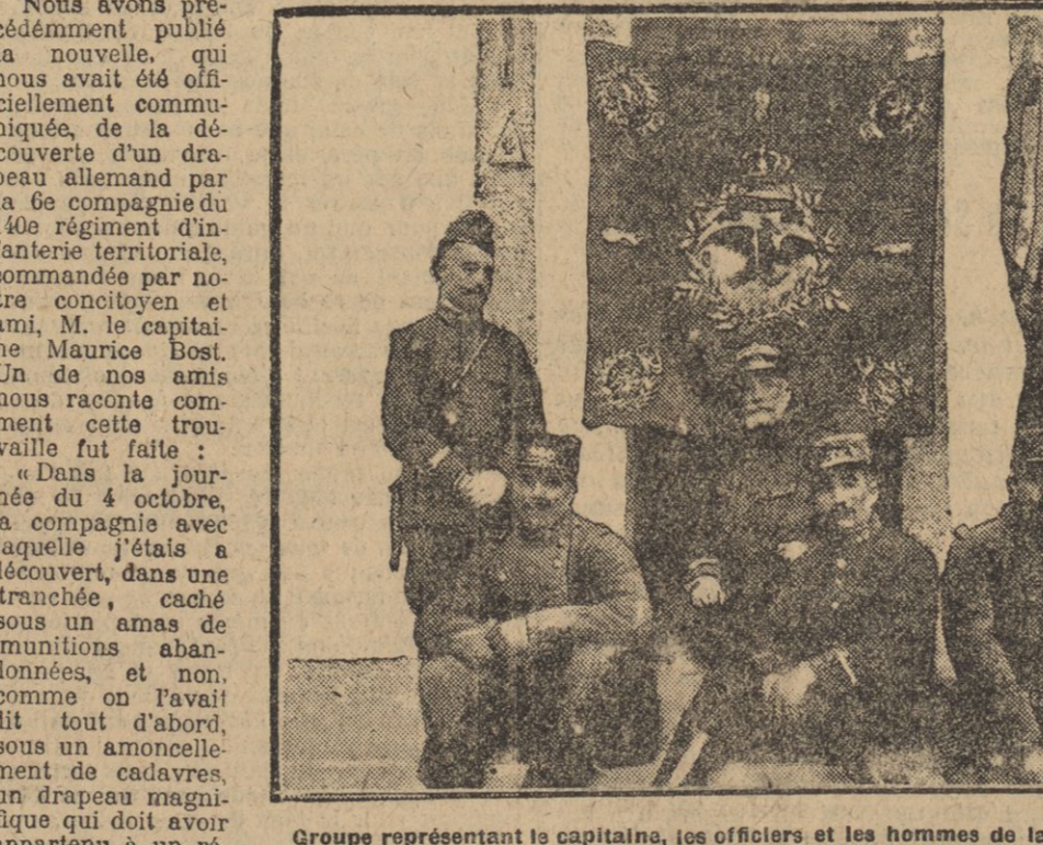
Groupes représentant le capitaine, les officiers et les hommes du 140e territorial qui ont trouvé le drapeau.