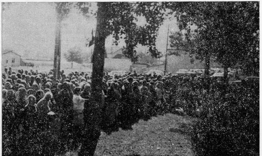
Una foule nombreuse écoutant les allocutions.

— El 16 de octubre presencia a la ceremonia del aniversario del rapatriamiento del Soldado Desconocido en AFN y al vino de honor ofrecido en los locales del 5, rue de la Pomme en Toulouse.