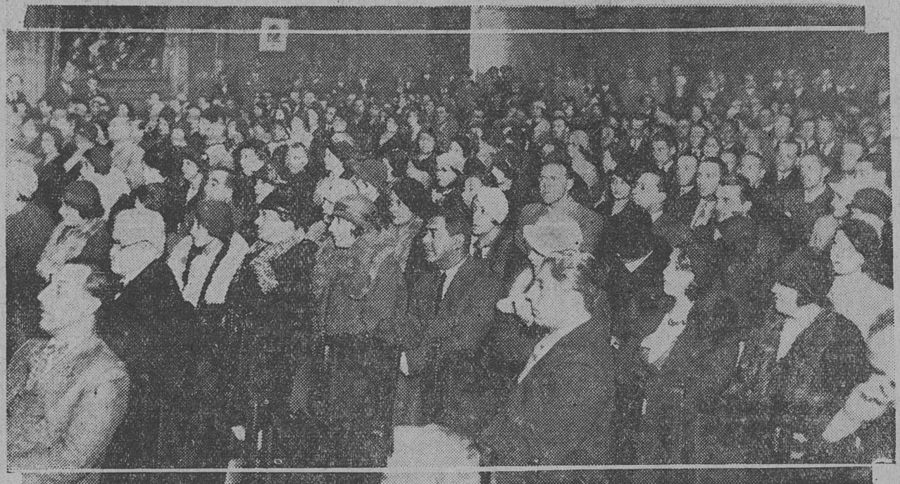
PARTE DEL PUBLICO QUE ASISTIO AL ACTO REALIZADO EN LA CASA SUIZA

Art. 20. — Al entrar en vigor el artículo 12 de esta ley, quedan derogadas las leyes números 9.148 y 9.151.