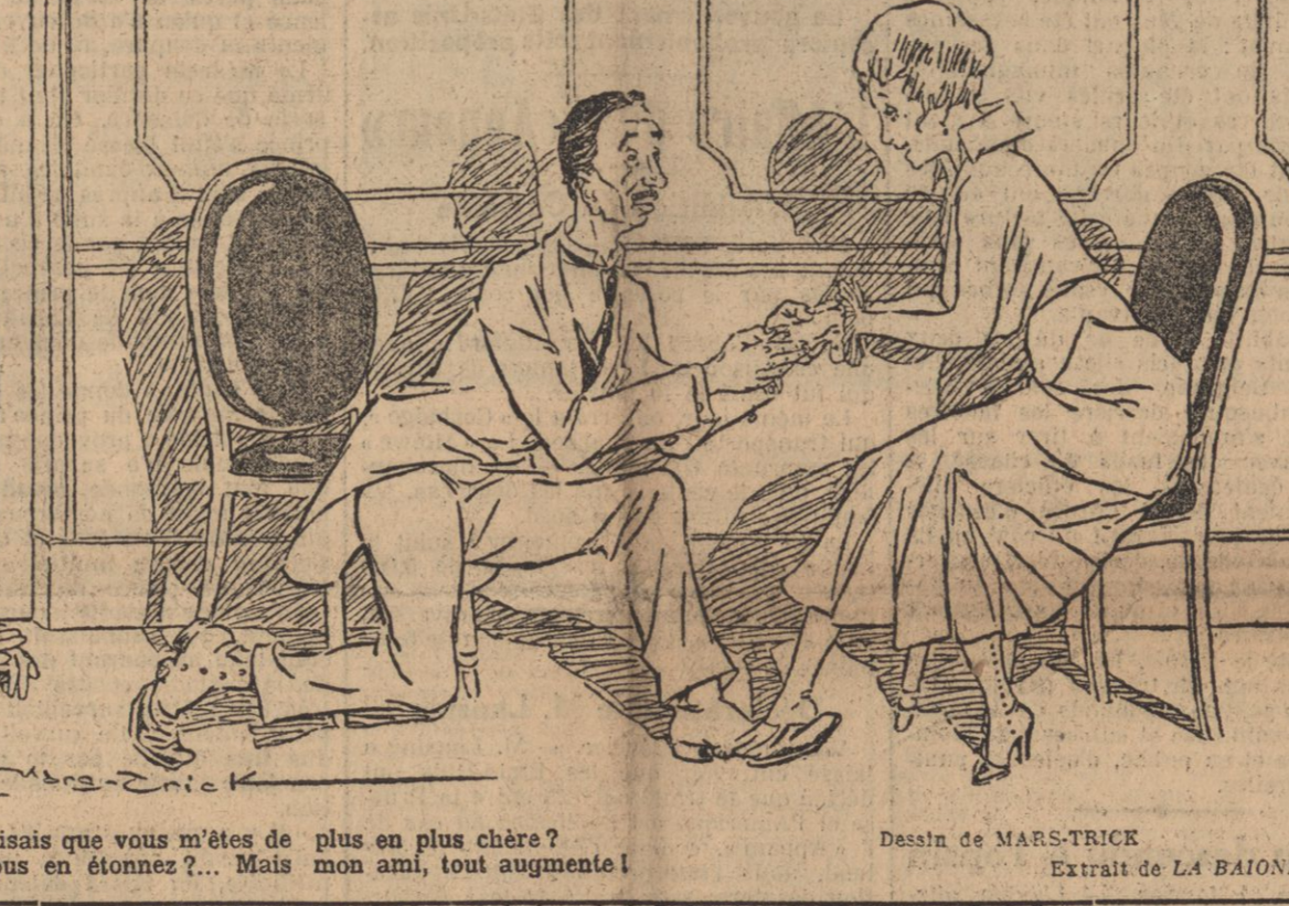
— Si je vous disais que vous m'êtes de plus en plus chère ? — Et vous vous en étonnez ? Mais mon ami, tout augmente !