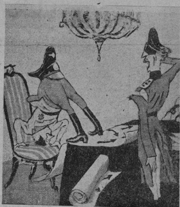
El general nazi: A sus órdenes mein Führer. El Führer: Espere usted un poco que voy a concentrar mis ideas.