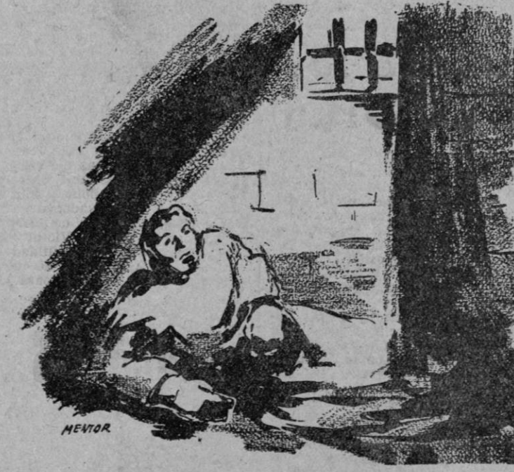
EL INFIERNO DE LA CARCEL DE SAN MARCOS

LA TUBERCULOSIS SE ENSEÑA CON LOS MEJORES HIJOS DE ESPAÑA. Los resultados de tan criminal régimen interior en las cárceles se observa en las tremendas dimensiones que adquiere la tuberculosis. En una de las cárceles madrileñas, un muchacho que había sido condenado a muerte, pena conmutada después por cadena perpetua, fue puesto en libertad. Pocos días más tarde, murió. La causa de ello fue una tuberculosis adquirida en la prisión. Lo mismo pasa en otros presidios. Un antifranquista que estuvo encarcelado durante cuatro años en un penal, al regresar a su casa, tuvo que ponerse inmediatamente en tratamiento, en manos de un médico, quien le diagnosticó una