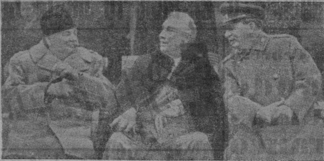
Churchill, Stalin y Roosevelt se entrevistan en Crimea

Estamos dispuestos a establecer, en cuanto sea posible, con nuestros aliados, una organización general internacional con el fin de mante-