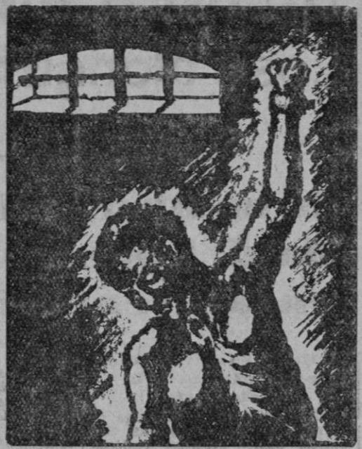
Con nuestro entusiasmo por ayudar a nuestros presos, debemos interesar también al pueblo francés de reconocidos sentimientos humanitarios y antifranquistas.

Creemos que no puede haber en Francia ningún español que se mantenga impasible ante esta cam-