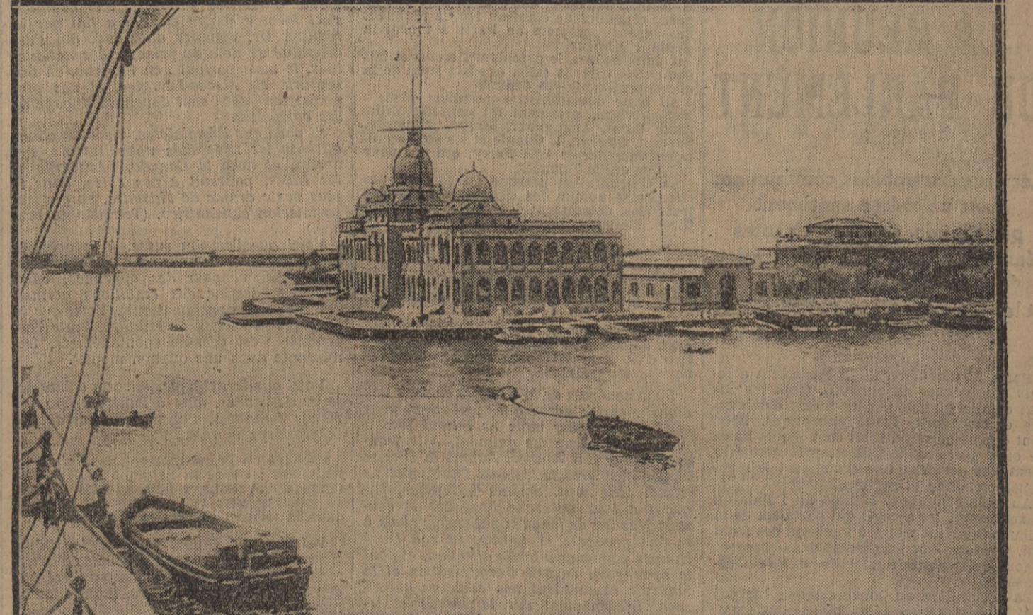
L'édifice où se trouvent les bureaux de la Compagnie du canal à Port-Salut.

calme... Les nerfs se détendent... la tête se décongestionne... une langueur d'apaisement se répand sur ce corps émacié... la vision qui le torturait a disparu... et c'est le sommeil sans rêve, le sommeil reposant, qui le surprend tel qu'il se trouve, étendu sur le tapis, sans qu'il se soit réveillé.