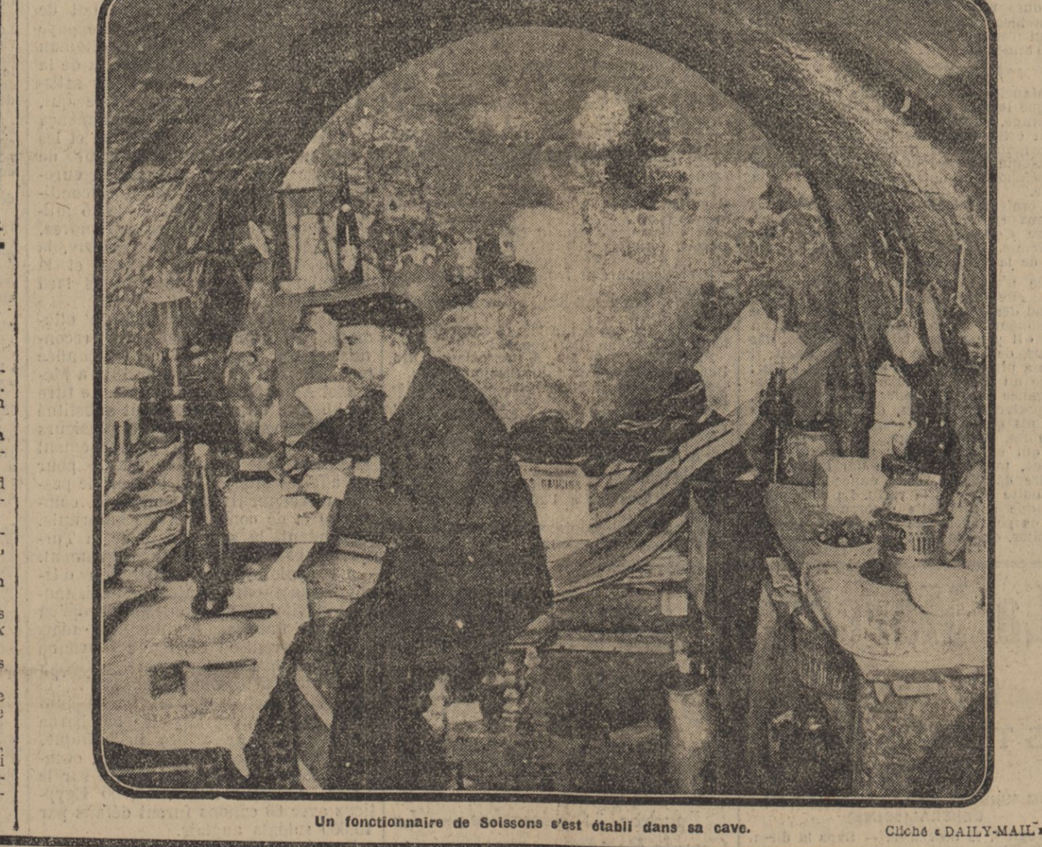
Un fonctionnaire de Soissons s'est établi dans sa cave.