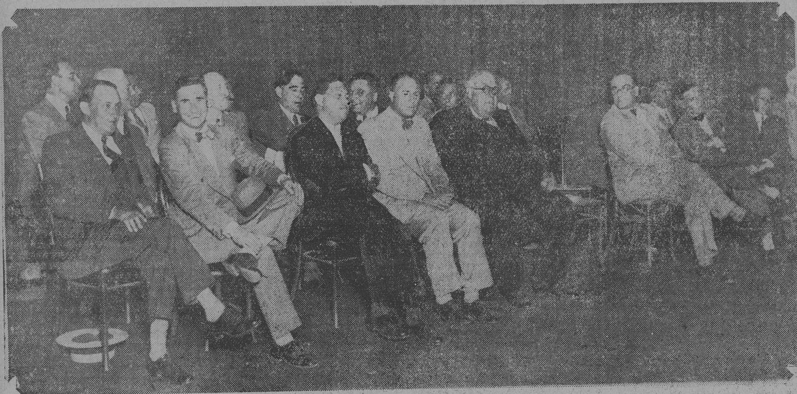
El escenario del teatro, en el que tomaron ubicación los candidatos, diputados y concejales socialistas.

dial unido y no los cuadros dispersos de facciones que se disputan entre sí el apoyo, la solidaridad del primer magistrado, y que esperan el alumbramiento de sus mequinos victorias de los ministros que se reparten las carteras del gabinete nacional.