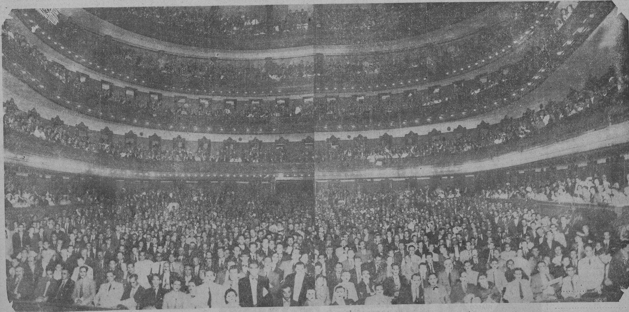
Como lo demuestra la nota gráfica, el interior del teatro Coliseo ofrecía anoche un aspecto imponente. Ocupadas totalmente las distintas instalaciones, el público se ubicó en los pasillos y antepalcos, no dejando libre un solo espacio de la amplia sala. En la calle, una verdadera multitud — que ocupaba toda la cuadra de la calle Charcas y gran parte de la plaza Libertad — escuchó la palabra de los oradores por medio de los altoparlantes instalados al efecto.