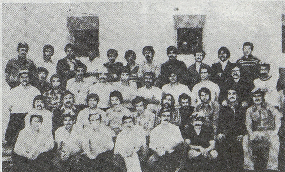
Parte de los presos políticos acusados de "delincuentes" por los militares fascistas.

Sin embargo, es necesario continuar la campaña para que todos los patriotas acusados de "delincuentes" por las autoridades fascistas sean puestos en libertad.