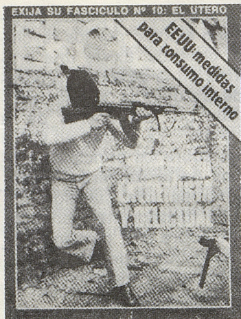
La "violencia" vista por la prensa reaccionaria.