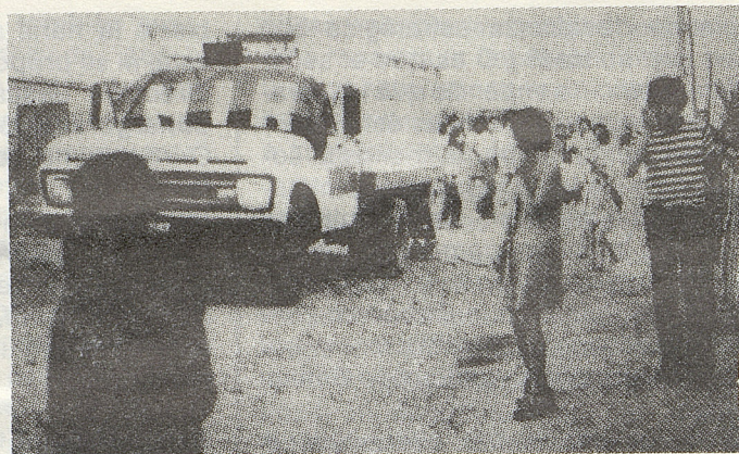
Un camión del reparto de leche, asaltado por la resistencia. Los productos fueron distribuidos en una población de Santiago.