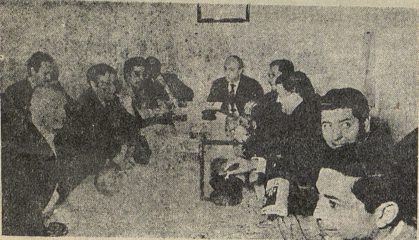
SAN SEBASTIAN Y SU CORTE: No paran la crisis.

SEMANARIO DE INFORMACIONES OBRERAS Y ESTUDIANTILES $ 60 - Buenos Aires, martes 6 de abril de 1971 - No. 258