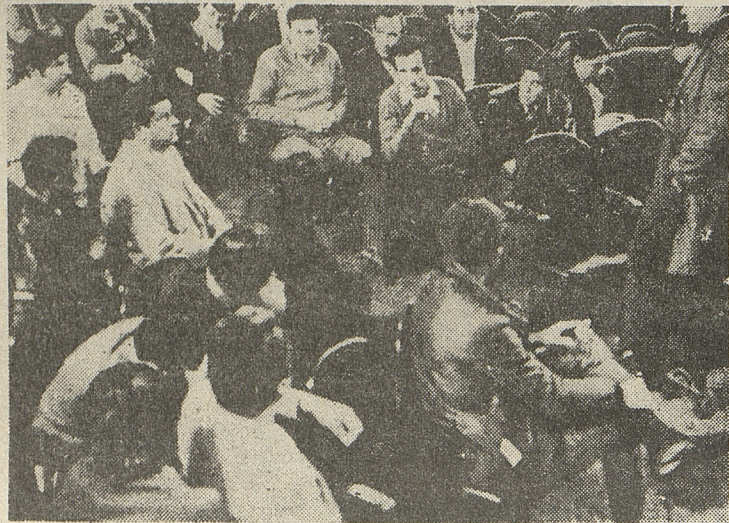
UNA REUNION DE ACTIVISTAS: El movimiento obrero debe discutir una salida independiente.