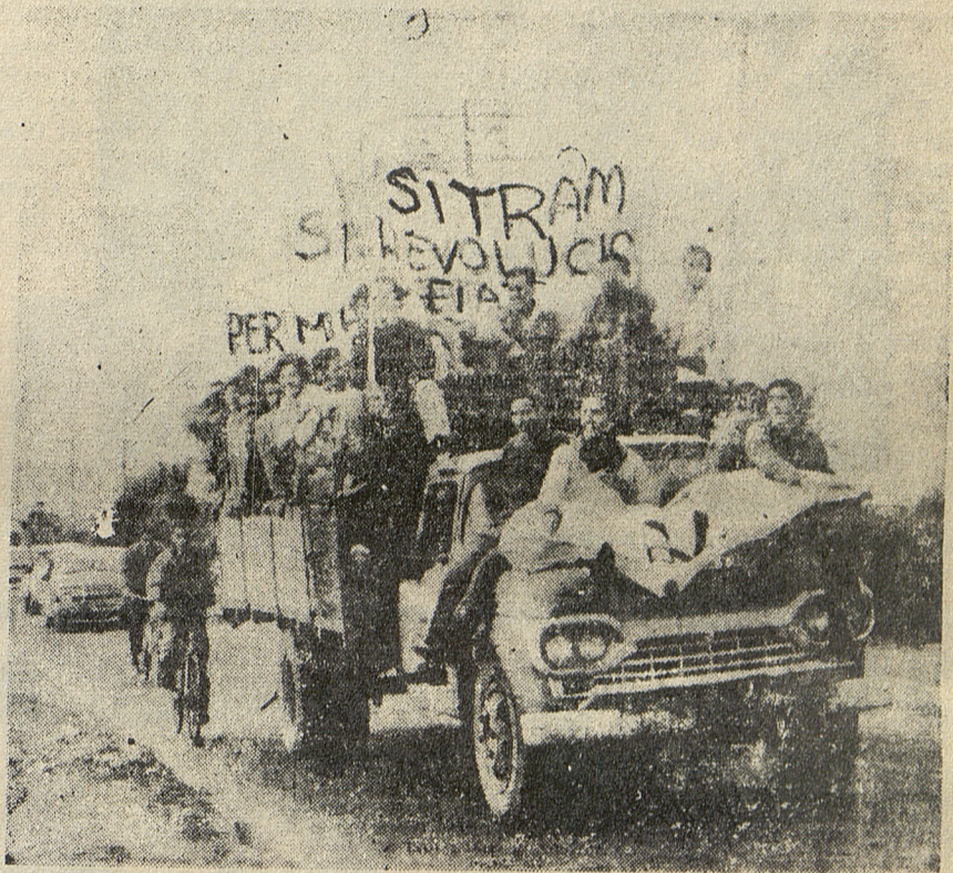
CORDOBA: Debemos impulsar la solidaridad. ARTICULO EN PAGINAS CENTRALES