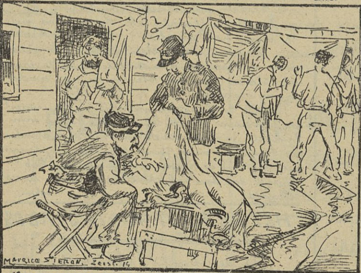
1. LES PUCES - DE VLOOIEN

LES CHASSES DU CAMP DE ZEIST-DE JACHTEN INT KAMP TE ZEIST