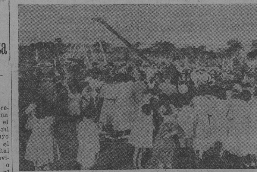
LA DOCTORA ALICIA MOREAU DE JUSTO DIRIGIENDO la palabra a la concurrencia

TAPIALES, 6 — Como se había anunciado oportunamente, se llevó a cabo, con todo éxito, la inauguración del campo de deportes que la Agrupación Femenina y la Biblioteca "Esteban Jiménez" poseen en la localidad. A la hora anunciada y con un público numeroso, ávido de escuchar la autorizada palabra de la Dra. Moreau de Justo, ésta inició su disertación teniendo palabras de estímulo para los organizadores de la obra de capacitación y enseñanza de los niños, en su doble aspecto físico y mental, con la creación del campo de ejercicios físicos y los cursos de enseñanza primaria para niños que por su edad no son admitidos en las escuelas del Estado. Una salva de aplausos premió la hermosa disertación de nuestra compañera, que fué atentamente escuchada por el numeroso público que a tal objeto se había reunido. Luego continuó el programa y la banda contratada al efecto ejecutó La Internacional, que fué coreada por el coro de la agrupación y los compañeros y compañeras presentes. Efectuóse por último el reparto de caramelos entre la concurrencia infantil. Fué ésta una hermosa demostración de lo que puede la constancia y la tenacidad de un puñado de compañeros que, entusiastas y decididos, han coronado con el éxito sus afanes de superación y de progreso. — (Corresponsal).