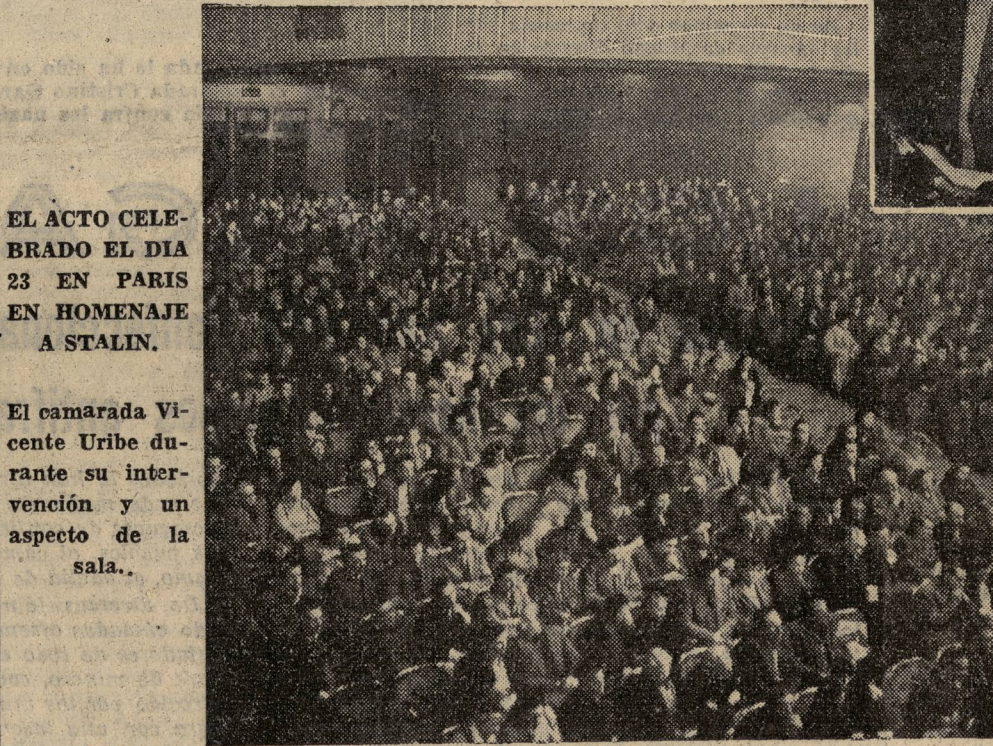
EL ACTO CELEBRADO EL DIA 23 EN PARIS EN HOMENAJE A STALIN.

En la pág. 6 Información de la sesión solemne celebrada en el Gran Teatro de Moscú