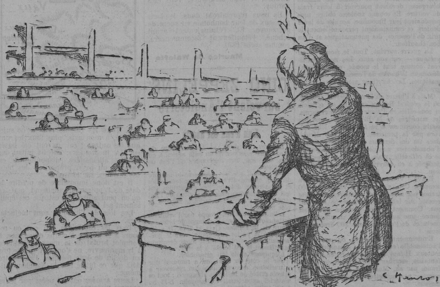
— J'affirme qu'il n'y a plus un seul Boche en France... ils sont tous naturalisés !