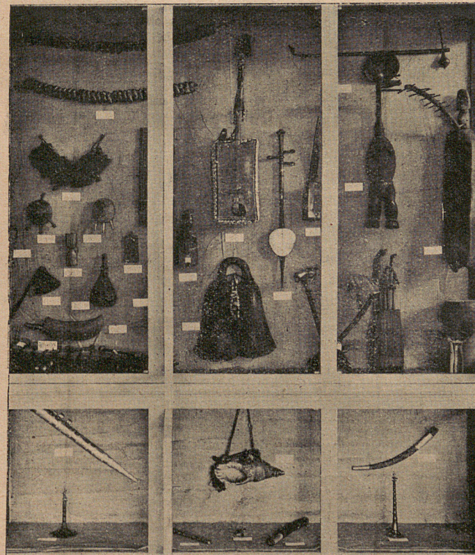
TYPE DE MAUVAISE PRESENTATION D'OBJETS Musée d'Ethnographie du Trocadéro, ancienne salle de l'« Afrique blanche ». Vitrine consacrée à la poterie. Les objets sont exposés en désordre, sans indication d'usage, de provenance, etc...

Car elle n'est pas une science pareille à la plupart des