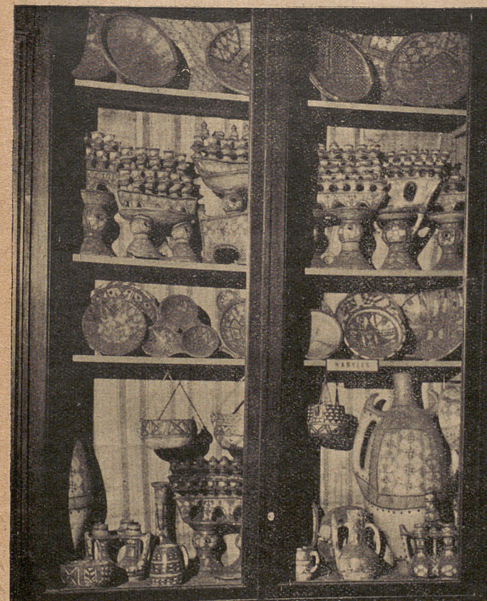
PRESENTATION ACTUELLE DES OBJETS AU MUSEE D'ETHNOGRAPHIE DU TROCADERO

NOTE DE LA REDACTION. — Tous ces extraits sont tirés des « Œuvres Politiques » de Karl Marx. Edition Costes, tome II. Les titres sont de la Rédaction.