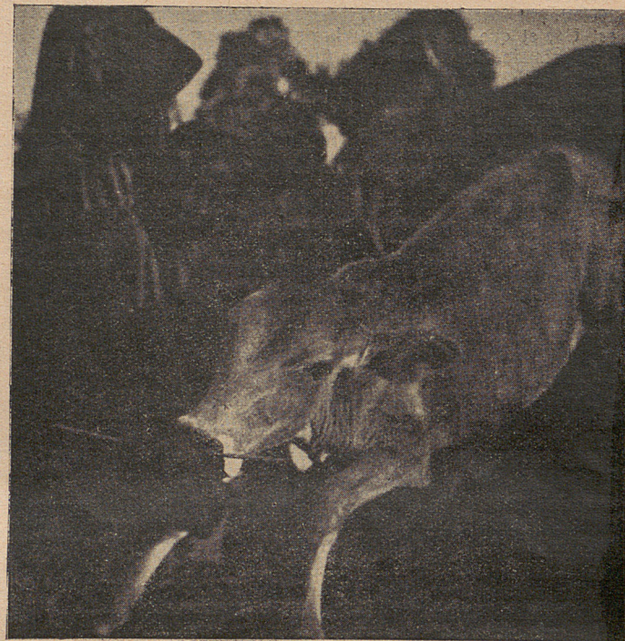
HAUTE VOLTA ... PHOTO MISSION DAKAR-DJIBOUTI EMPECHE TETTEE MOSSI L'objet est photographié en place, avant d'être recueilli. Chaque objet récolté est accompagné d'une fiche mentionnant sa provenance, son nom en dialecte indigène, son usage, sa fabrication, les croyances et coutumes qui s'y rattachent, etc...

autres. Les maîtres de nos écoles sociologique et anthropologique l'ont dotée, certes, d'une méthode aussi précise et rigoureuse que celle qui était autrefois l'apanage exclusif des sciences dites « exactes »; mais elle se distingue de ces dernières en ce qu'elle est plus humaine et plus vivante, elle dont l'objet essentiel est d'étudier les hommes, dans les rapports sociaux qu'ils ont entre eux, dans leurs institutions, dans leurs langues, dans leurs coutumes, sans qu'il soit question de tenir une civilisation ou une race quelconque (à commencer par la nôtre) comme supérieure, a priori , ou de poursuivre un autre but que déceler les traits communs à toute l'humanité, qu'il s'agisse du coolie indo-chinois qui revendique sa liberté, du nègre du Congo qui sculpte patiemment une figure rituelle ou du brasseur d'affaires ultra-moderne qui dicte son courrier à une armée de sténo-dactylographes, dans un décor américain.