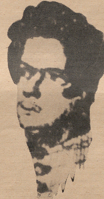
KARL MARX à 18 ans.

4. Tussy (Marx, Eléonore) (1856-1898). — Fille cadette de Marx, prit une part active au mouvement ouvrier anglais.