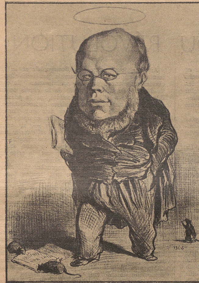
Proudhon, par Daumier.

D'abord, la critique de Marx et celle de Proudhon ne sont pas issues de la même source. La première part de l'é-