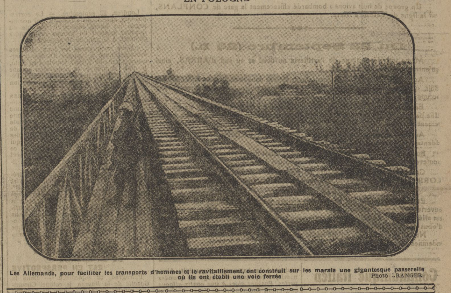
Les Allemands, pour faciliter les transports d'hommes et le ravitaillement, ont construit sur les marais une gigantesque passerelle où ils ont établi une voie ferrée.

SUR LE FRONT ITALIEN Les officiers du cuirassé « Amal » sur le front de l'Isone, avec leurs hommes engagés volontaires dans l'artillerie.