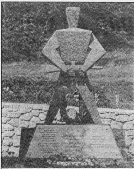
Sculpteur : Manuel PEREZ VALIENTE