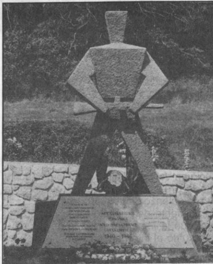
Sculpteur : Manuel PEREZ VALIENTE