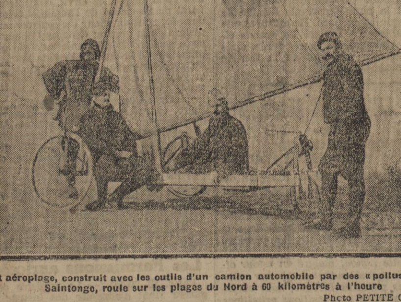
Un aéroplane, construit avec les outils d'un camion automobile par des « pilotes » de la Salette...