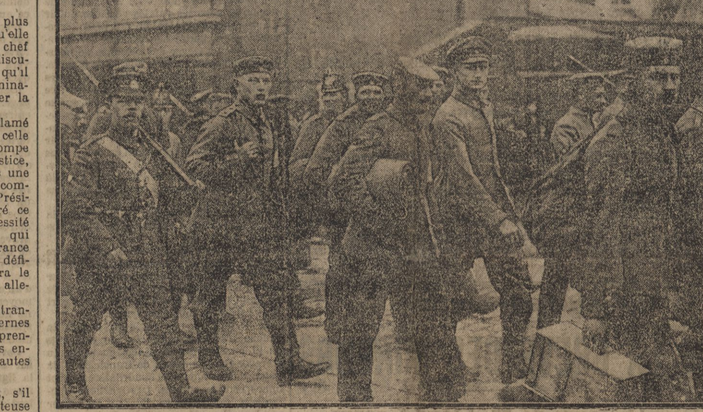
CONVOI DE PRISONNIERS ALLEMANDS TRAVERSANT UNE VILLE ANGLAISE