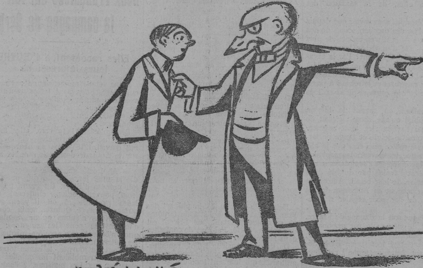
— Les Boches, Monsieur ? En vingt circulaires, moi, je les fais circuler !