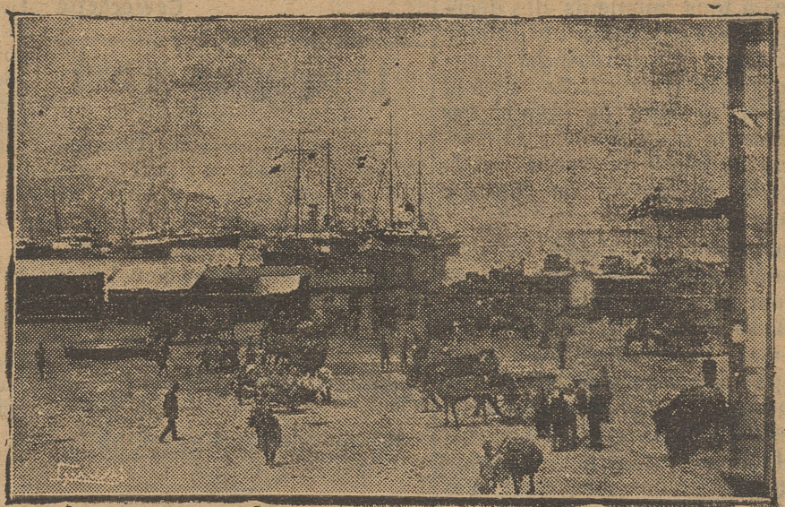
LE PORT DE RODOSTO est particulièrement animé ces derniers jours. Le généralissime grec Hadjanesti l'a visité, il y a quelques jours, lors de sa venue en Thrace pour passer en revue les troupes grecques.

sujet des intentions du gouvernement grec sont bien fondées, elles signifieraient une opposition armée aux forces Alliées se trouvant actuellement à Constantinople et amèneraient immédiatement les Grecs en conflit direct avec les Alliés.