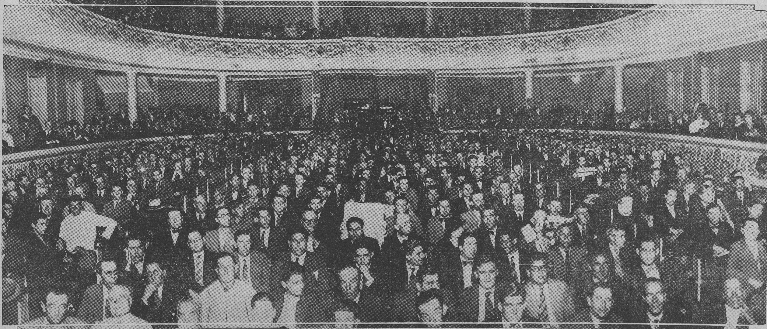
ASPECTO QUE OFRECIA LA SALA DEL TEATRO CORRIENTES DURANTE EL ACTO SOCIALISTA.