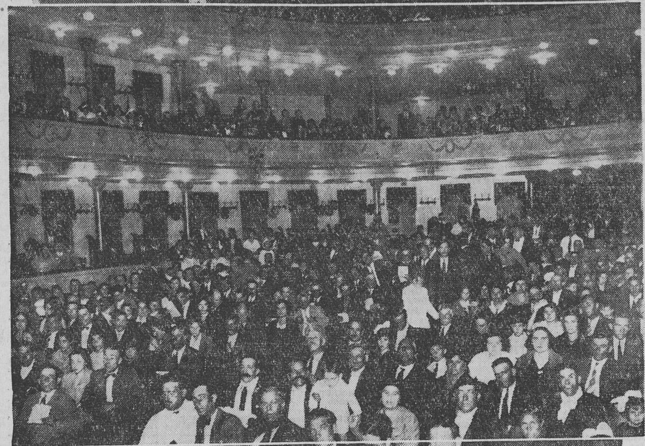
ASPECTO QUE OFRECIA LA SALA DEL TEATRO MARCONI, DURANTE EL ACTO ORGANIZADO POR LA UNIÓN OBREROS MUNICIPALES.

La petición que se formula es tanto más justificada, cuando que ni si-