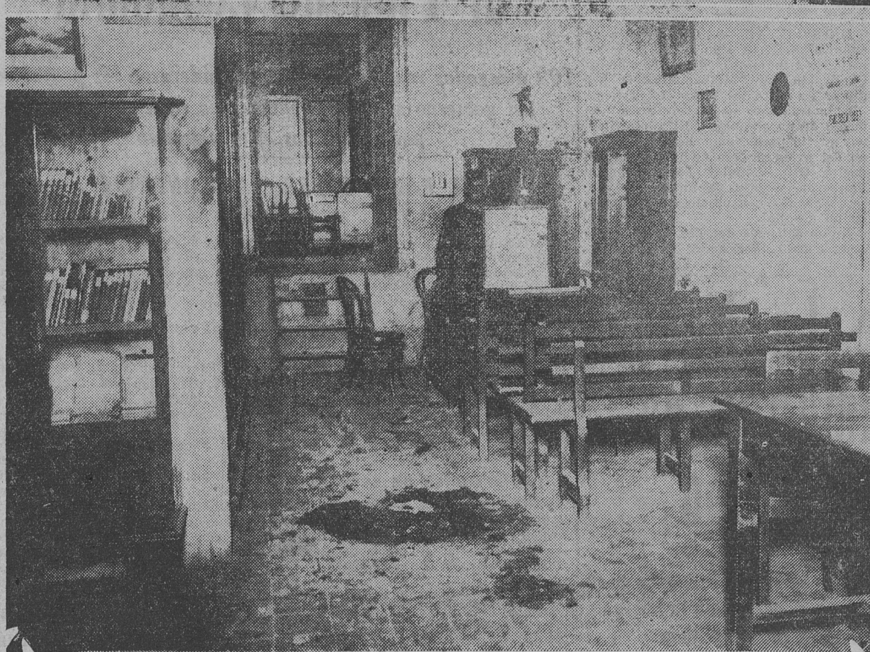
EL GRABADO MUESTRA DOS ASPECTOS DEL SALON DE ACTOS DEL CENTRO SOCIALISTA de la segunda, asaltado por las hordas fascistas, en el cual pueden observarse las huellas dejadas por las bombas incendiarias arrojadas por los legionarios.