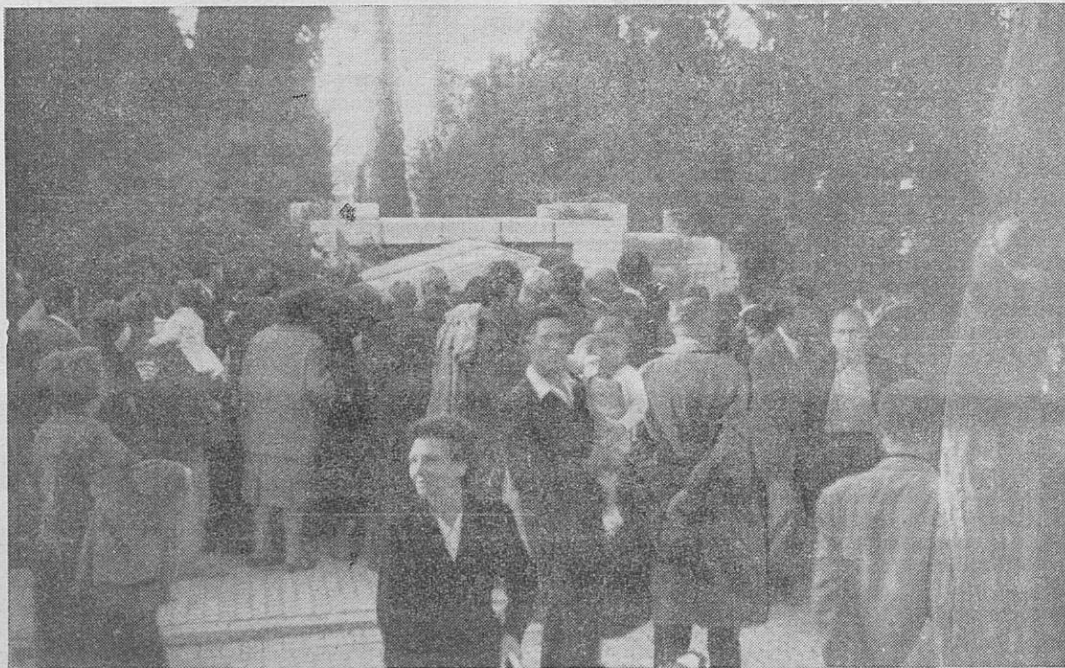
Como recuerdo imperecedero al Maestro y como demostración de que la siembra de ideas que él realizó sigue fructificando, damos esta fotografía del mausoleo del «Abuelo», ante la cual los días 1 y 2 de noviembre, sábado 1 día de difuntos y día 2 domingo, desfilaron miles de trabajadores y otros democratas españoles a depositar flores en homenaje emotivo y aleccionador.

Se trataron después otros asuntos sobre los que no recayeron acuerdos, por ser solamente de información.