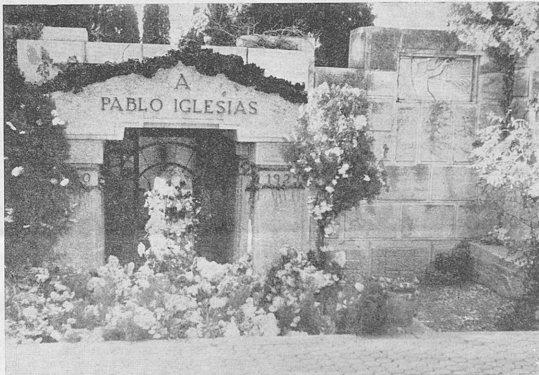
En este aniversario de la muerte de nuestro Maestro Pablo Iglesias, publicamos esta fotografía del mausoleo tomada el día 1 de noviembre. Pablo Iglesias sigue siendo guía luminoso de la clase trabajadora española de la que él formó parte y a la que consagró por entero su vida, siendo su conducta el ejemplo vivo de la bondad de sus ideas.