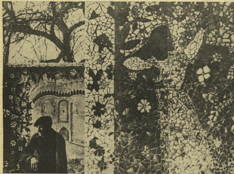
Demeure de Raymond Isidore (figurant sur la photo) employé à l'entretien du cimetière de Chartres : le rêve matérialisé.

Preons la première, preons Paris, par exemple, la spéculation effrénée sur les loyers des immeubles anciens et les prix des logements neufs tend à en interdire l'accès au prolétariat. Pour ce qui reste, encore non touché par le mouvement des prix, on tend à détruire les immeubles déclarés vétustes ou frappés d'alignement, ou encore trop petits (pas assez de sur-