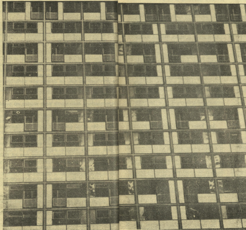
Le déperissement de l'Etat.

La cité-dortoir proposée au prolétariat-consommateur des loyers équivalents à 30 ou 40 % de son salaire moyen, un lieu d'habitation à une distance moyenne de son travail équivalente à deux heures de transport quotidien dans des conditions abrutissantes et un cadre déshumanisé à un point tel qu'il est difficile de concevoir pire.