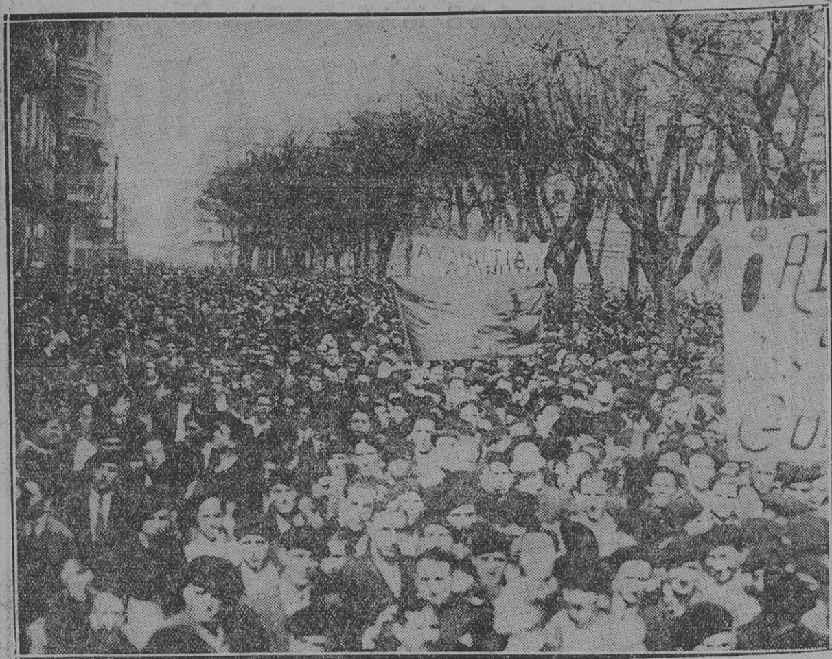
CONCURRENTES AL MITIN PRO PRESOS POLITICOS DE SAN SEBASTIAN

En San Sebastián, la bella ciudad balearica del Cantábrico, se realizó días antes a la proclamación de la república española, un grandioso mitin para pedir la libertad de los presos políticos.