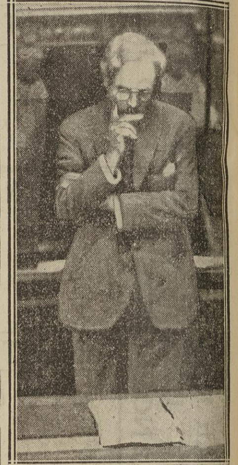
M. JEAN LONGUET